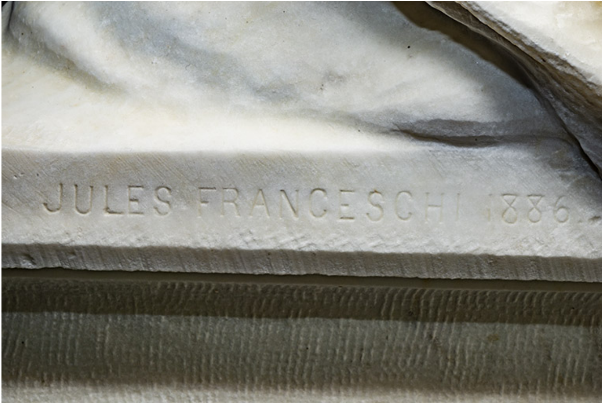
Signature et date gravées sur le côté droit de la terrasse.

39, Lons-le-Saunier avenue Camille Prost