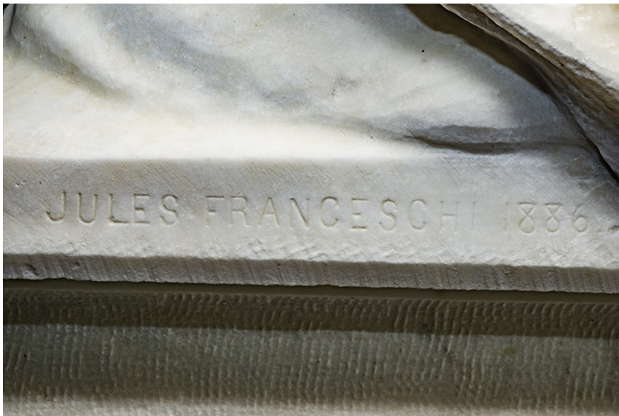
Signature et date gravées sur le côté droit de la terrasse.

39, Lons-le-Saunier avenue Camille Prost