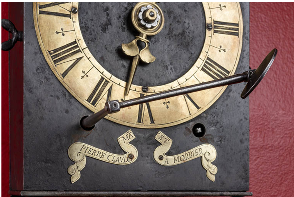
Détail du cadran, caches mobiles ouverts avec la clef insérée.