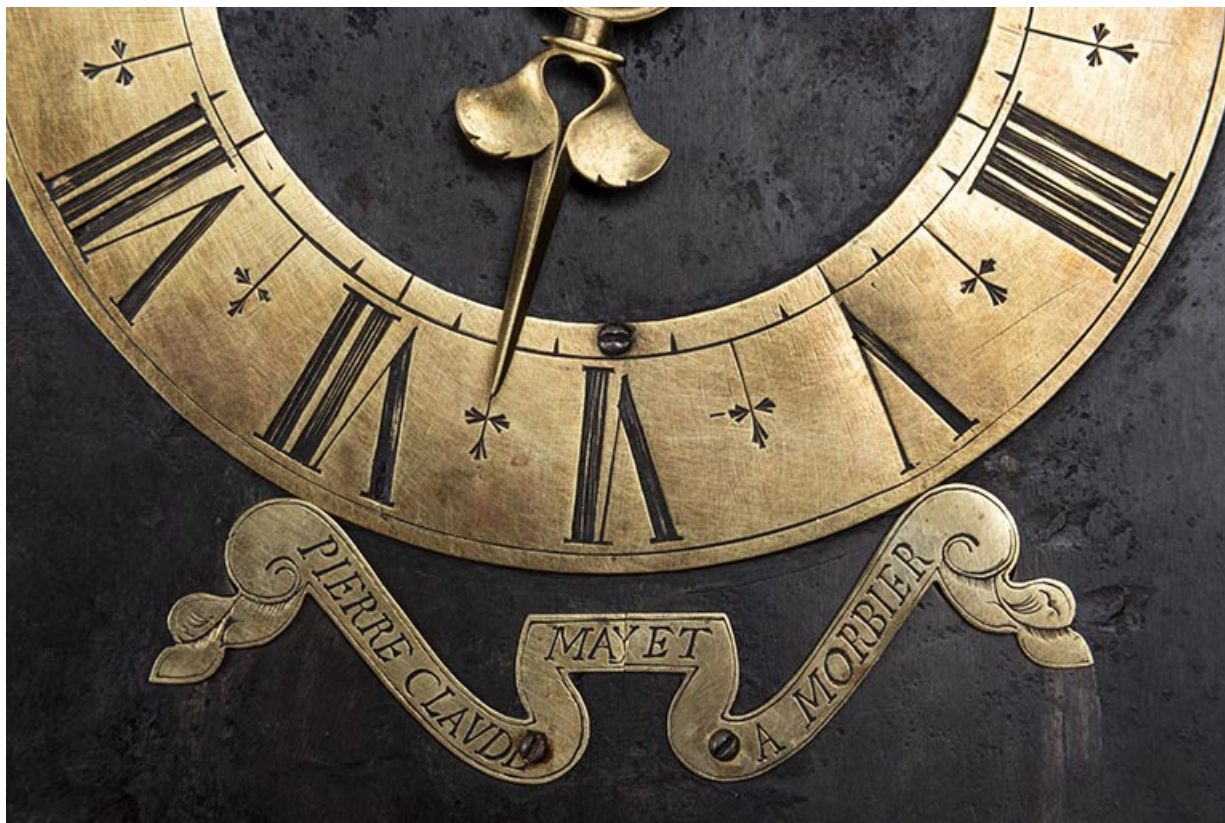
Détail du cadran, caches mobiles fermés.