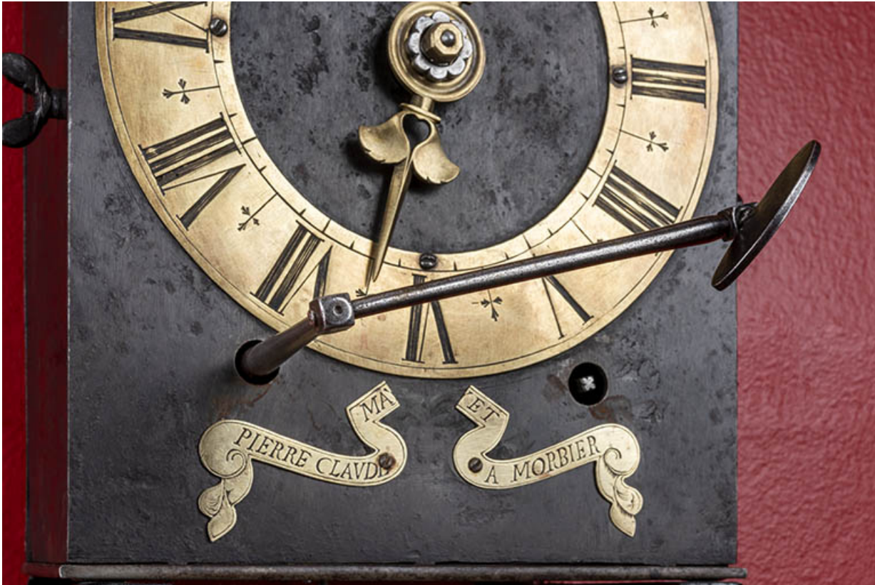
Détail du cadran, caches mobiles ouverts avec la clef insérée.