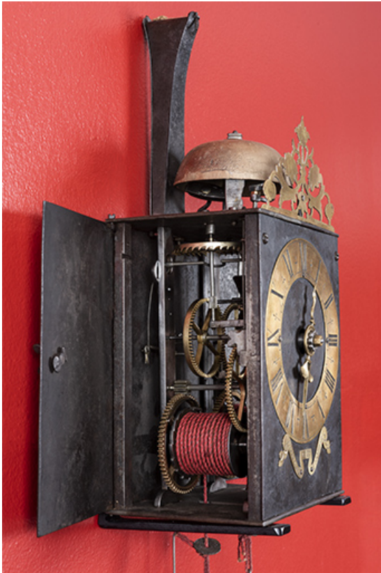
Vue latérale gauche, porte ouverte.