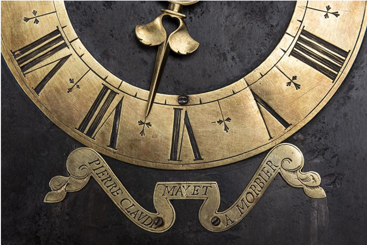
Détail du cadran, caches mobiles fermés.