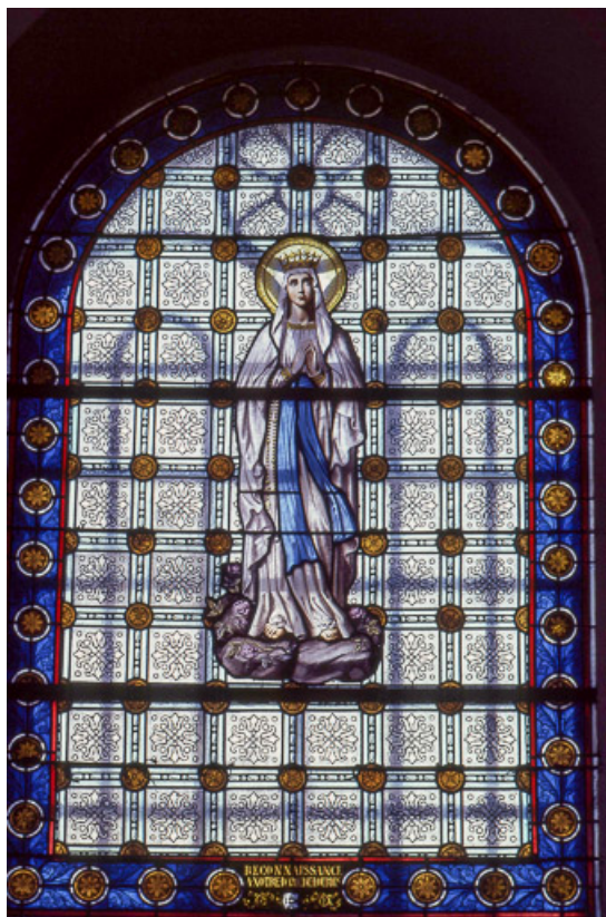
Baie 5 : vue d'ensemble.