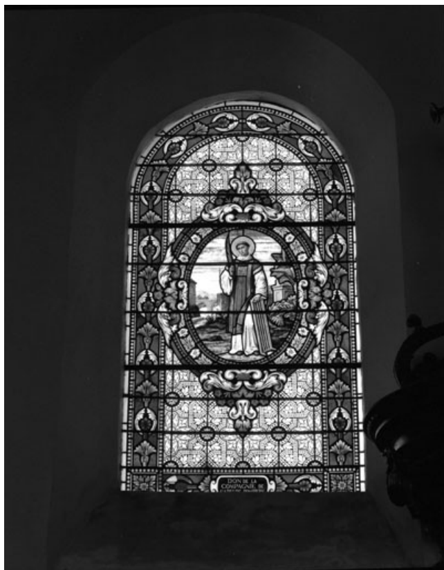
Baie 5 : vue d'ensemble.