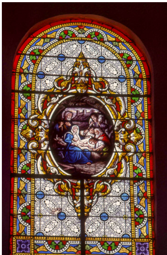
Baie 1 : vue d'ensemble.