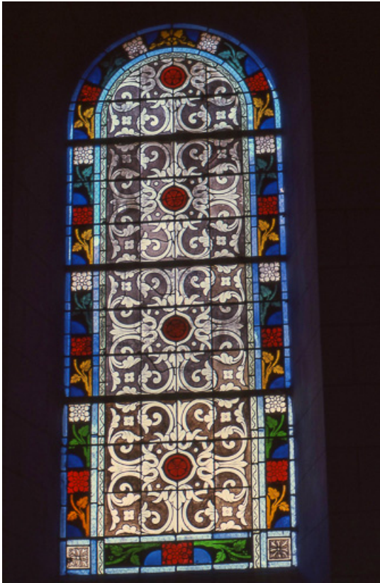
Baie 7 : vue d'ensemble.