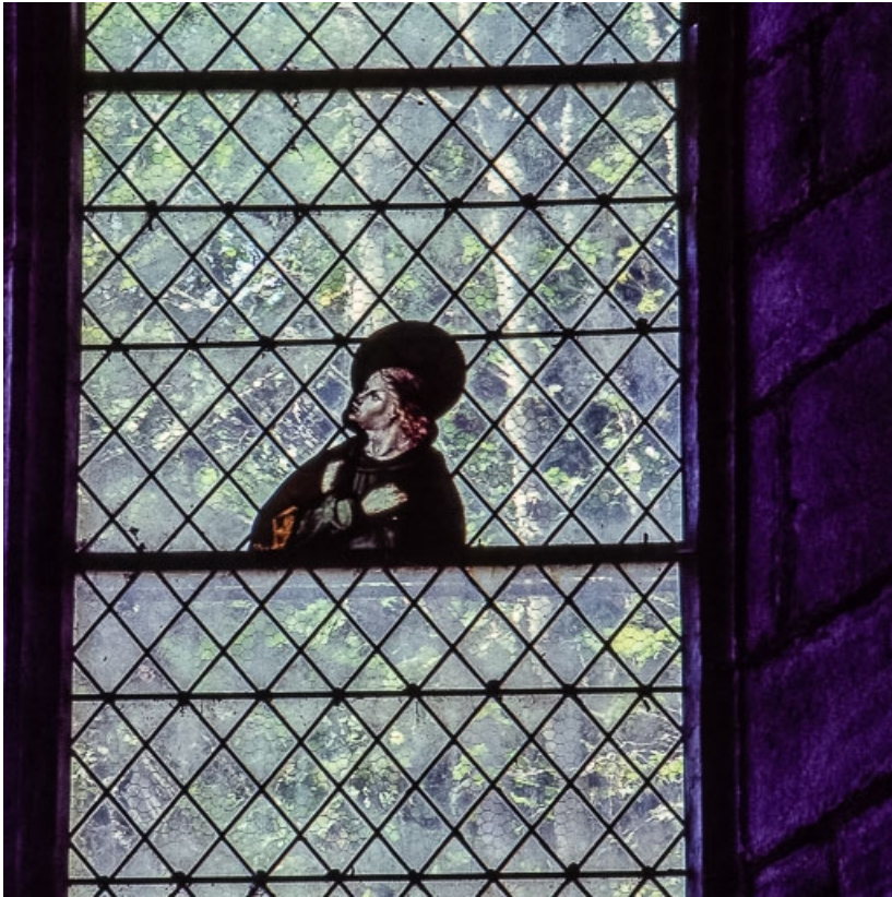
Détail du Calvaire : buste de saint Jean (lancette droite).

39, Salins-les-Bains place Saint-Anatoile