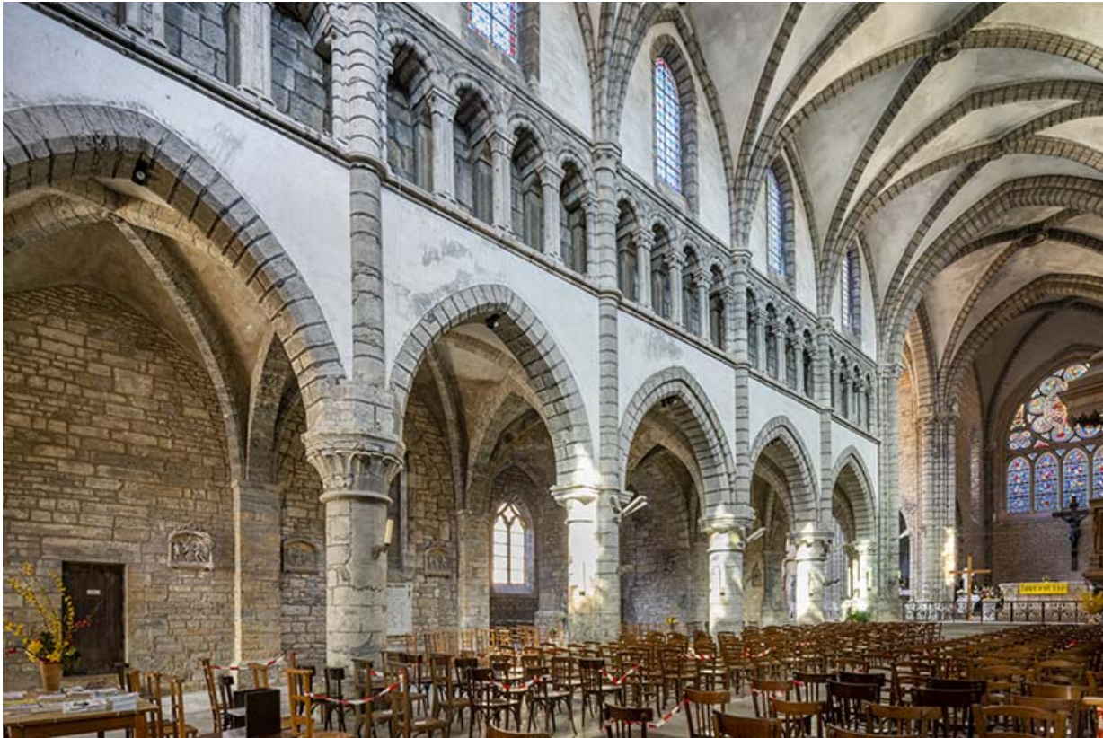
Vue depuis l'entrée en 2021.

39, Salins-les-Bains place Saint-Anatoile