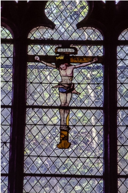
Détail du Calvaire : Christ en croix (lancette centrale). 39, Salins-les-Bains place Saint-Anatoile