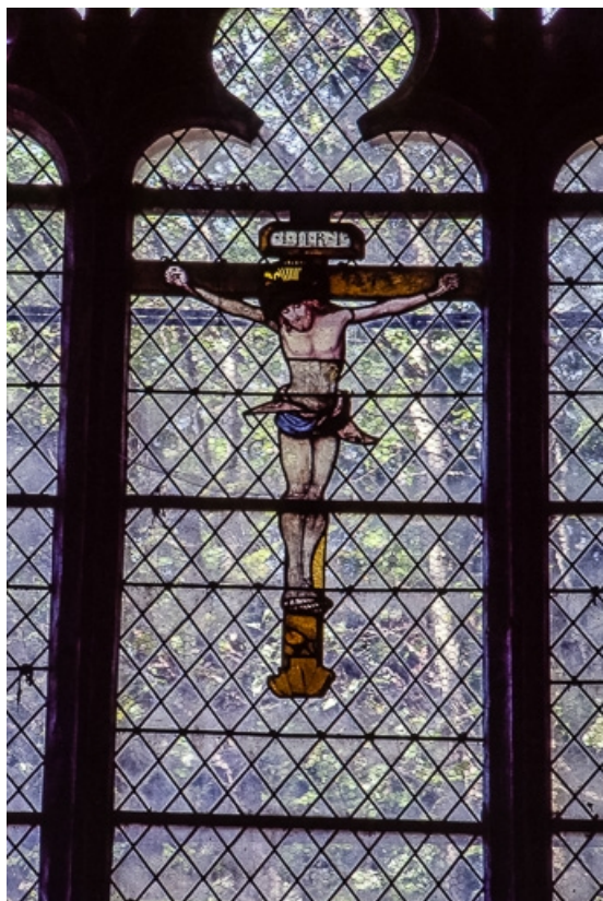
Détail du Calvaire : Christ en croix (lancette centrale). 39, Salins-les-Bains place Saint-Anatoile