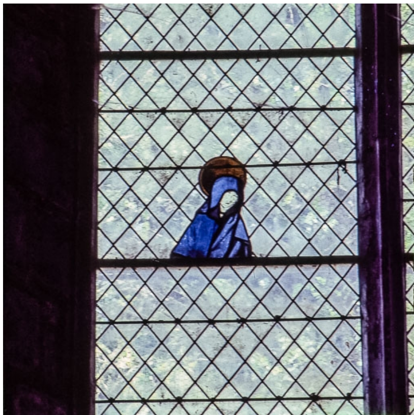
Détail du Calvaire : buste de la Vierge (lancette gauche).

39, Salins-les-Bains place Saint-Anatoile