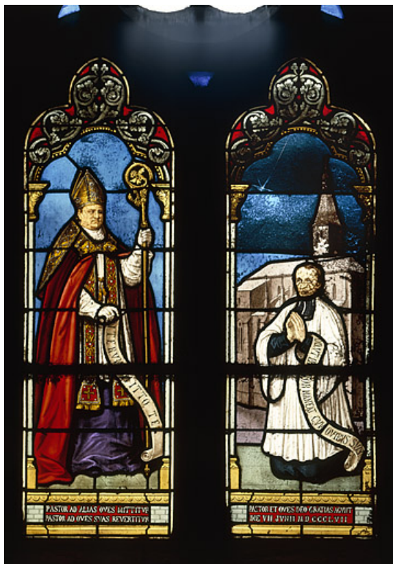
Baie 2 : vue d'ensemble.