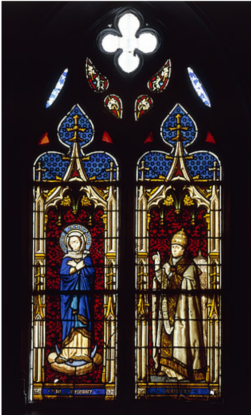
Baie 1 : vue d'ensemble.