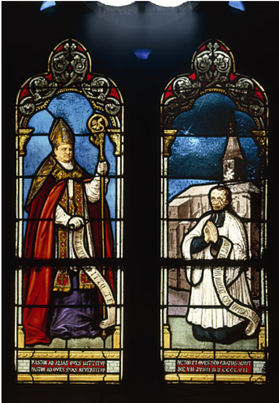
Baie 2 : vue d'ensemble.