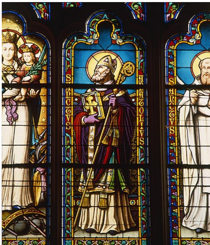
Détail : saint Anatoile.