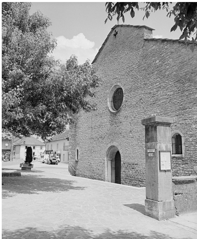
Façade ouest de l'église.