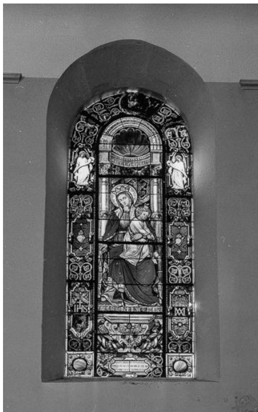
Baie 1 : vue d'ensemble.