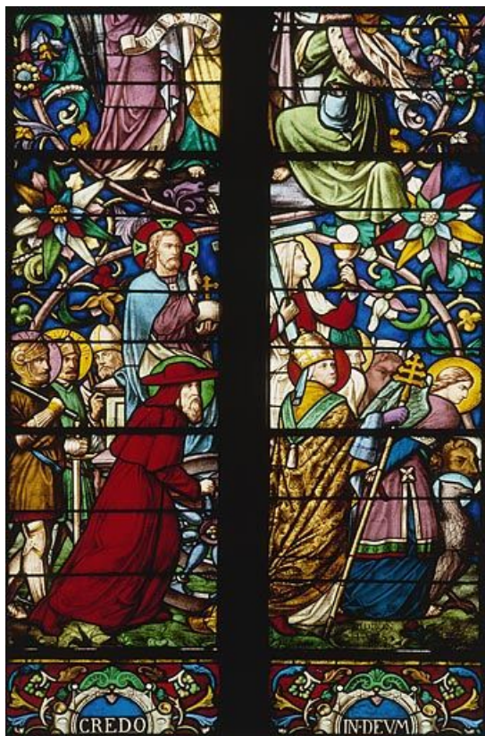
Détail : sainte Hostie. 39, Saint-Amour