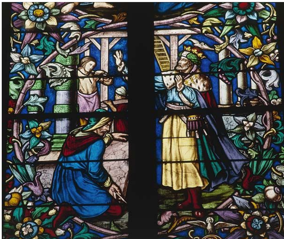
Détail : retour du fils prodigue (?). 39, Saint-Amour