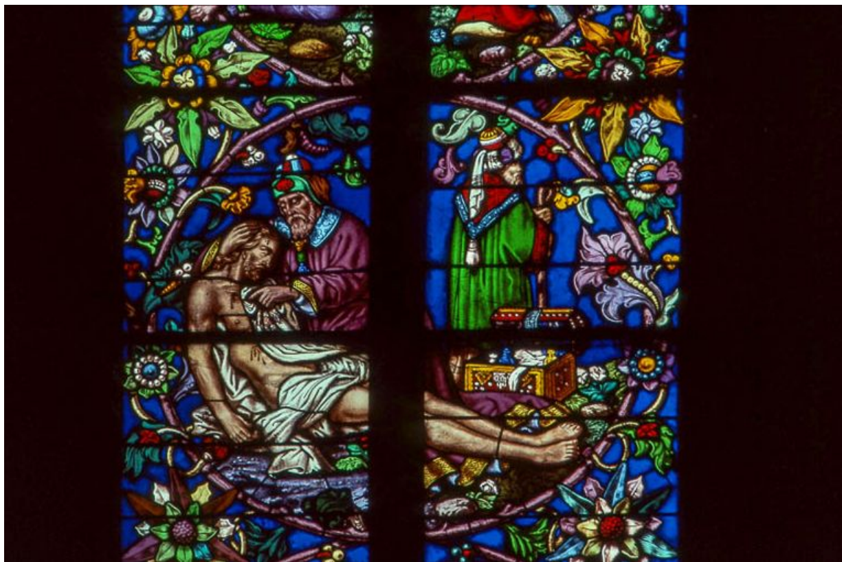
Détail : Josephe d'Arimathie met le Christ au tombeau. 39, Saint-Amour