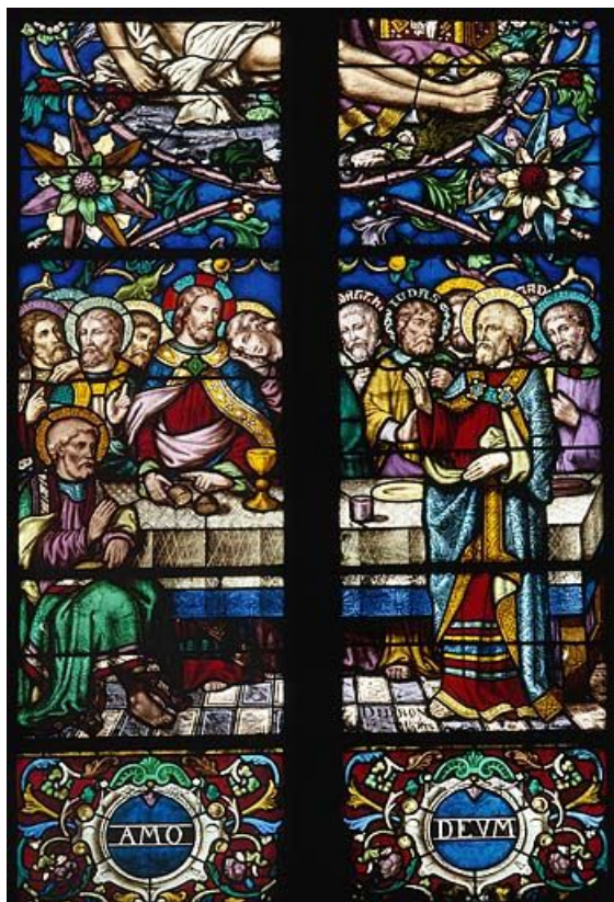
Détail : la Cène. 39, Saint-Amour