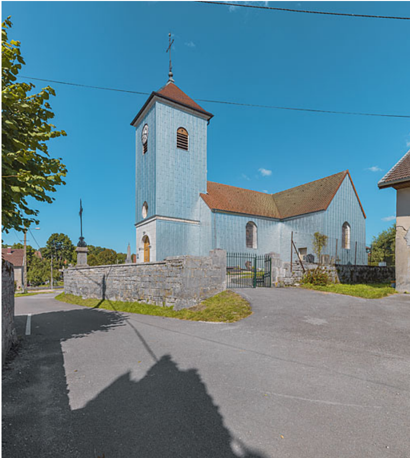
Eglise paroissiale Saint-Philippe-et-Saint-Jacques en 2021. 39, Saffloz