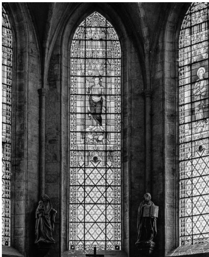
Baie 100 : vue d'ensemble.