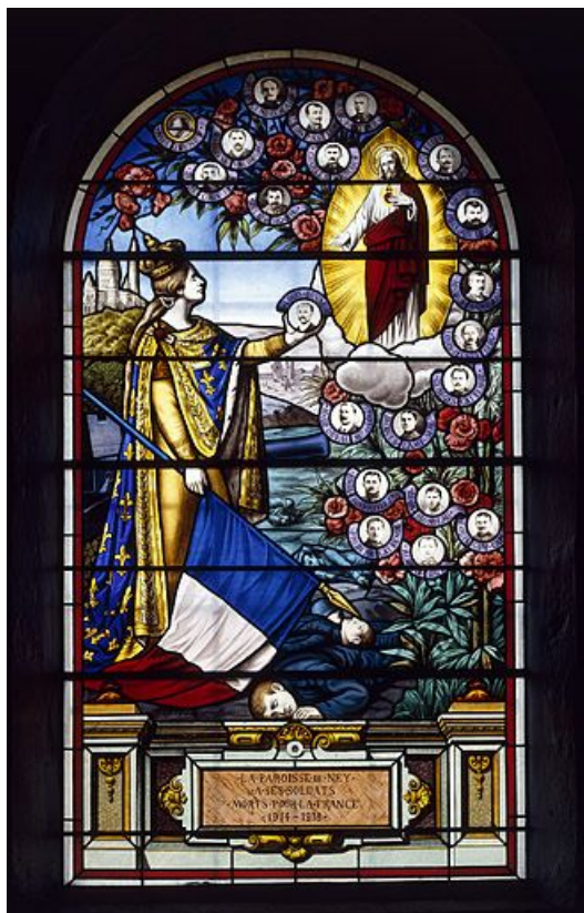
Baie 6 : "La paroisse de Ney à ses soldats morts pour la France 1914-1918" 39, Ney