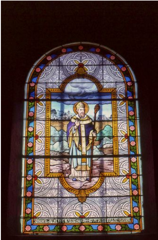
Baie 2 : saint Martin.