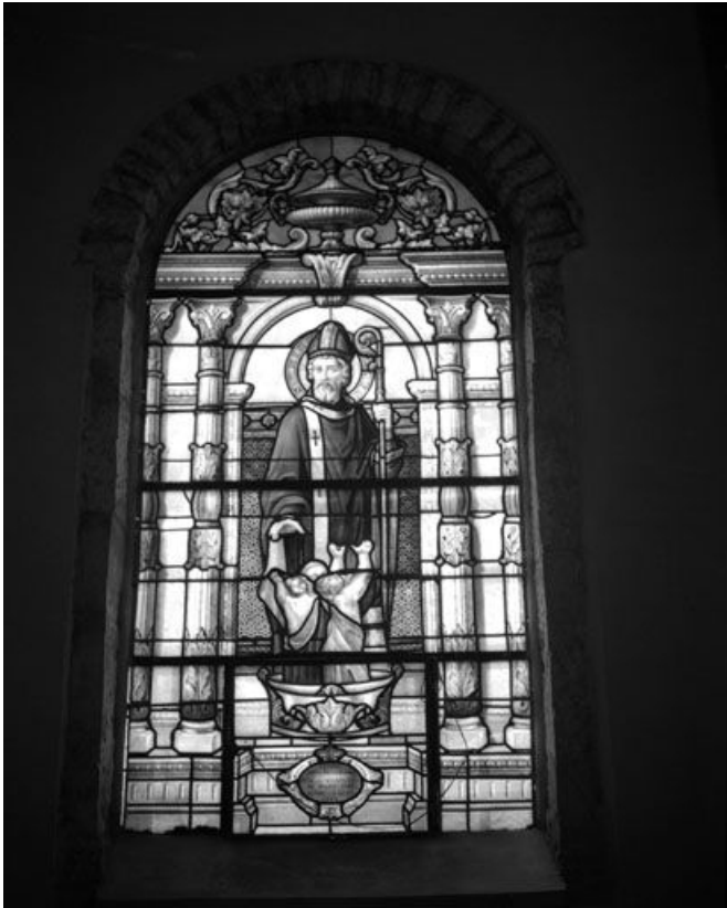
Baie 2 : vue d'ensemble.