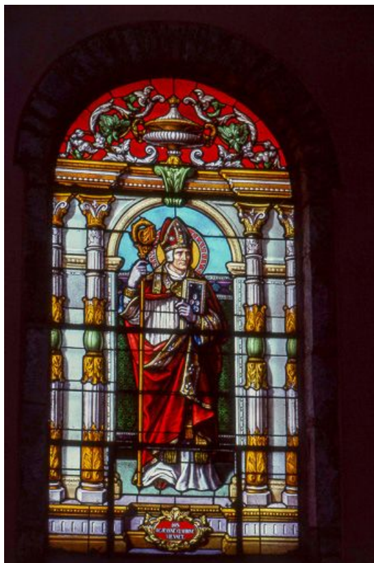
Baie 1 : vue d'ensemble.