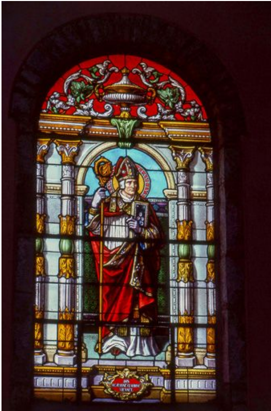
Baie 1 : vue d'ensemble.