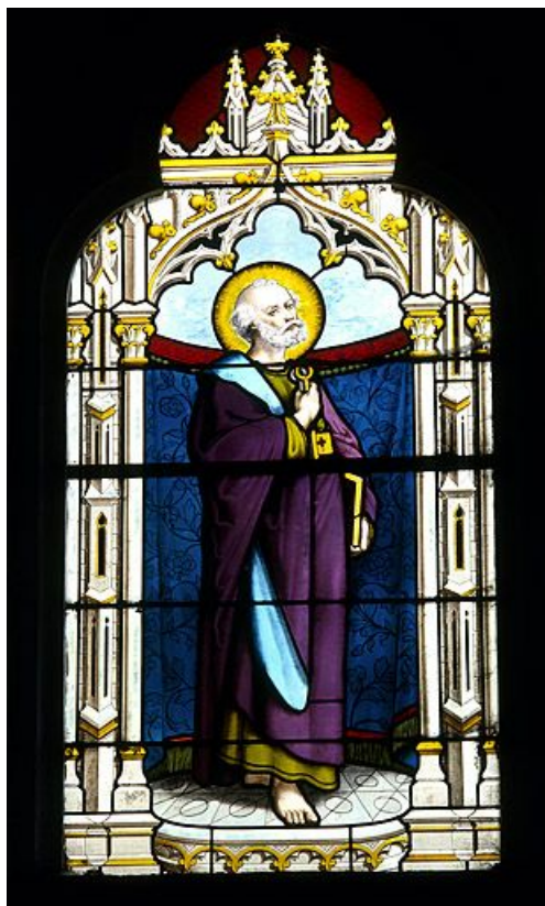
Baie 1 : vue d'ensemble.