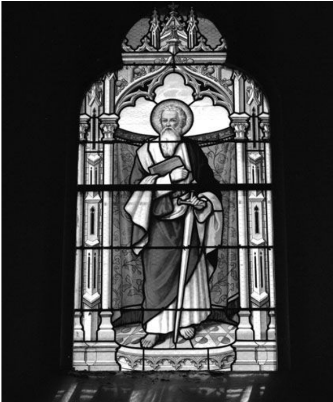
Baie 2 : vue d'ensemble.