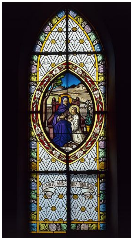
Baie 8 : vue d'ensemble.