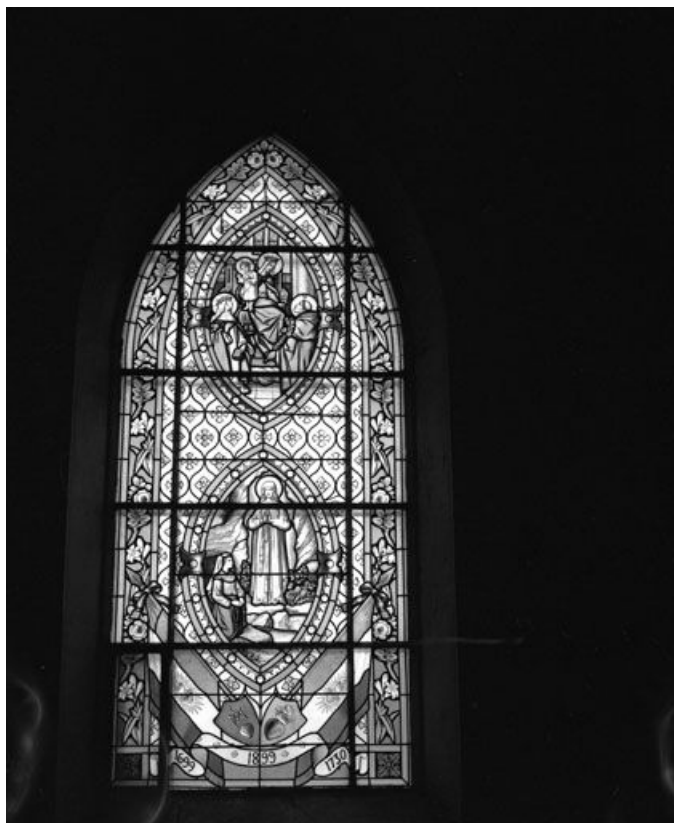
Baie 4 : vue d'ensemble.