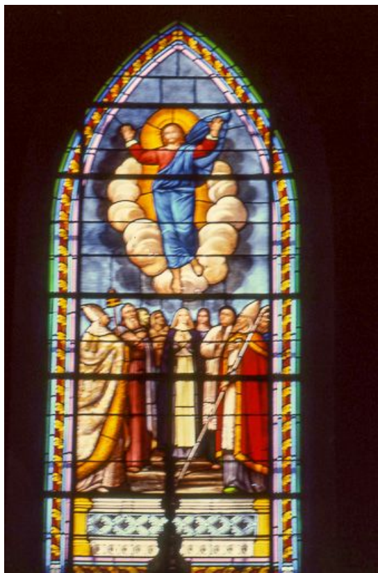
Baie 0 : vue d'ensemble.