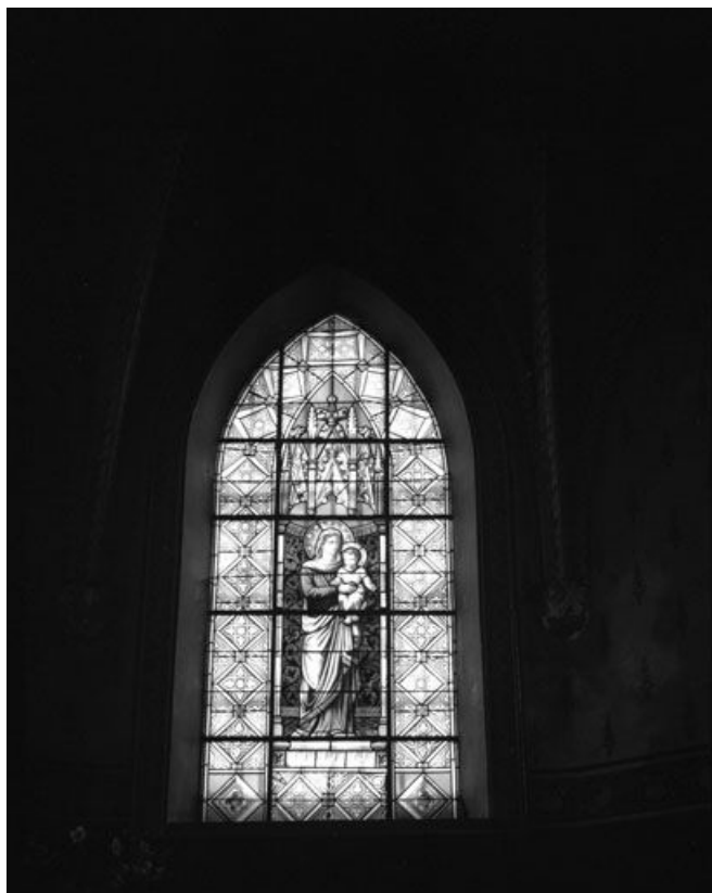
Baie 2 : vue d'ensemble.