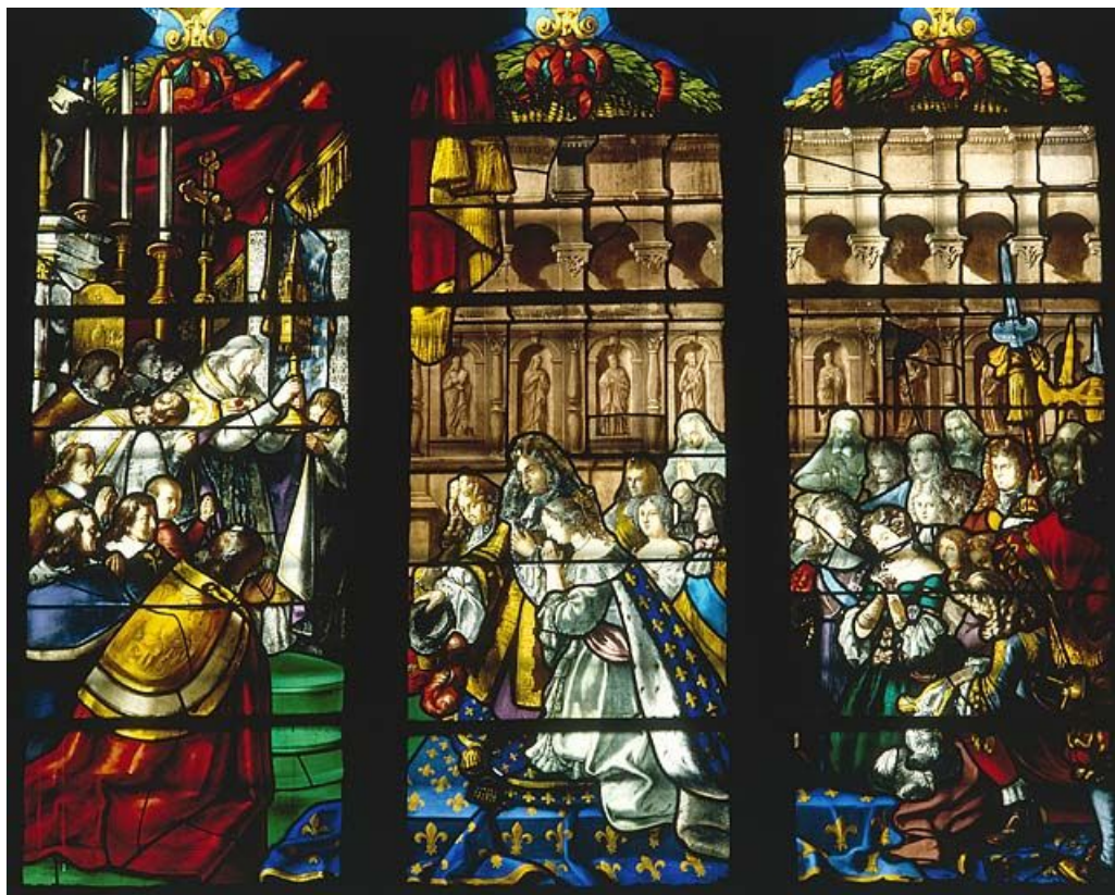
Détail de la baie 6 : Louis XIV adorant la sainte Hostie.

39, Dole place Nationale Charles de Gaulle