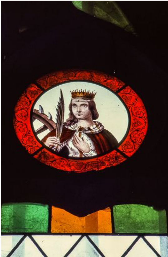
Médailon droit : sainte Catherine d'Alexandrie 39, Bersaillin