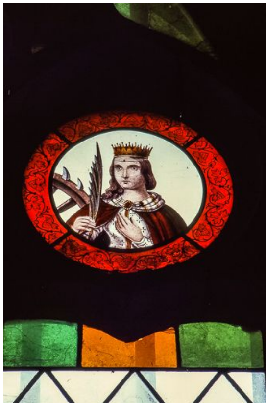
Médailon droit : sainte Catherine d'Alexandrie 39, Bersaillin