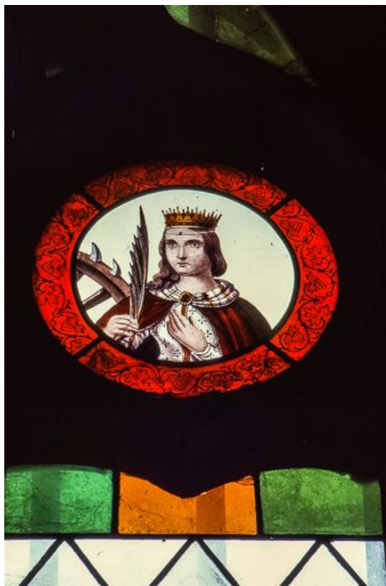
Médaille droite : sainte Catherine d'Alexandrie 39, Bersaillin