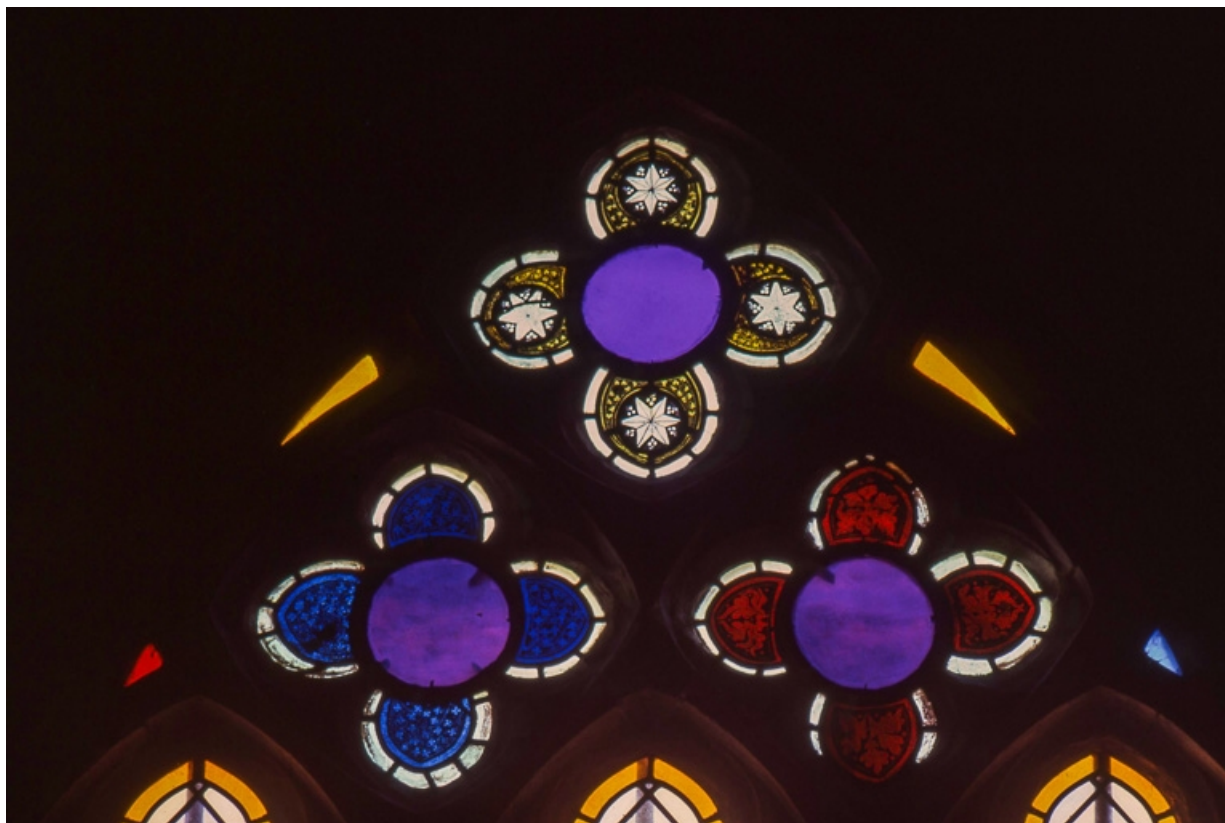
Vue d'ensemble du tympan avec ses trois quadrilobes.