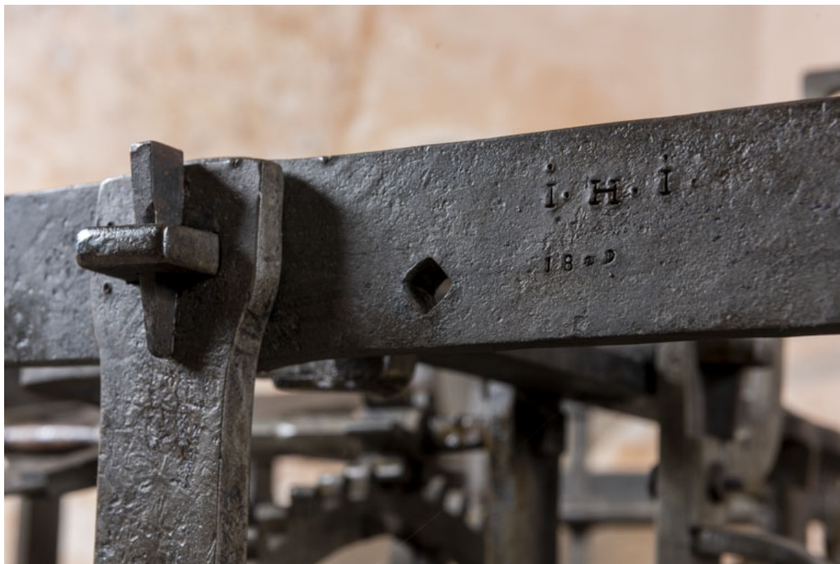
Face antérieure : inscription gravée sur le montant supérieur du corps avant droit (partage du temps). 39, Orgelet place de l' Eglise