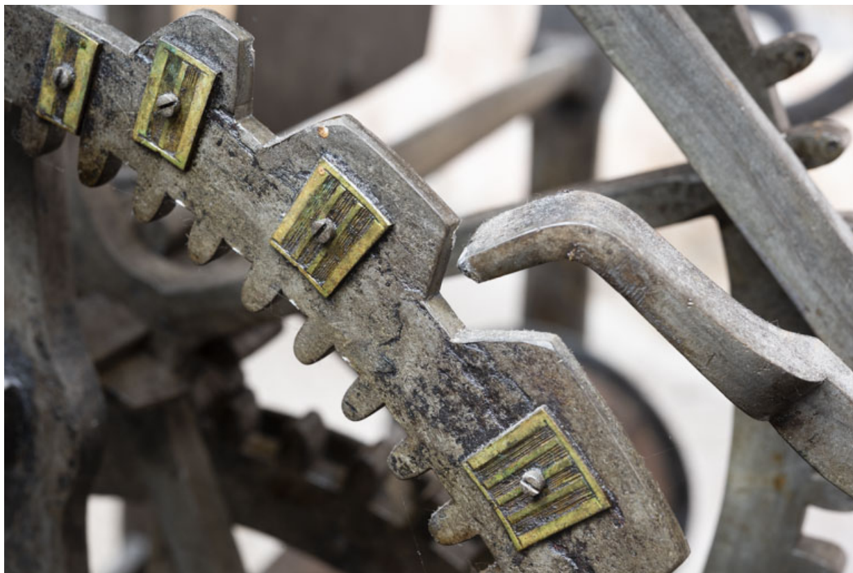
Corps avant gauche (sonnerie des heures) : détail de la roue de compte. 39, Orgelet place de l' Eglise