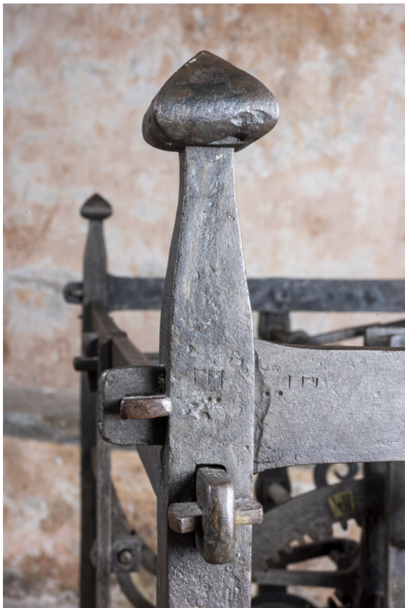
Face latérale droite : système d'assemblage des montants et marques de repérage. 39, Orgelet place de l' Eglise