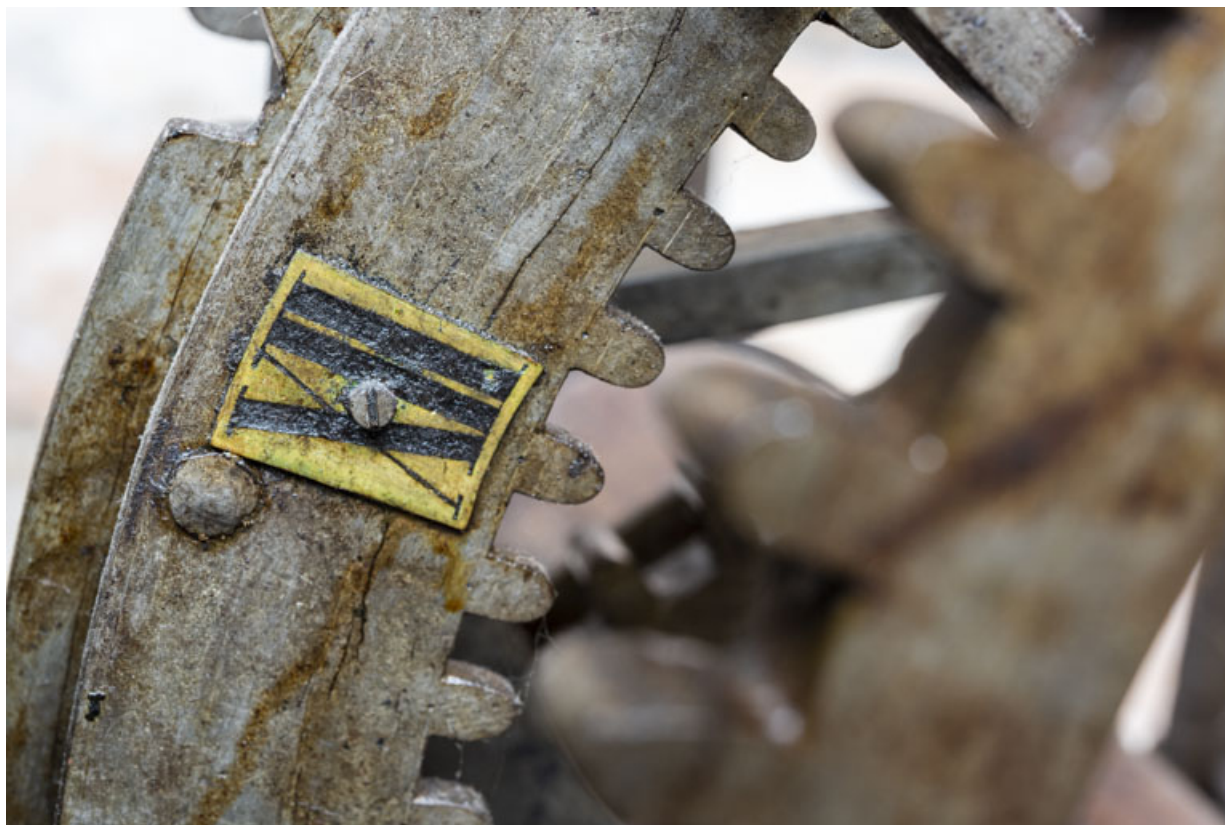
Corps arrière droit (sonnerie des quarts d'heure) : plaque en laiton rivée sur la roue de compte. 39, Orgelet place de l' Eglise