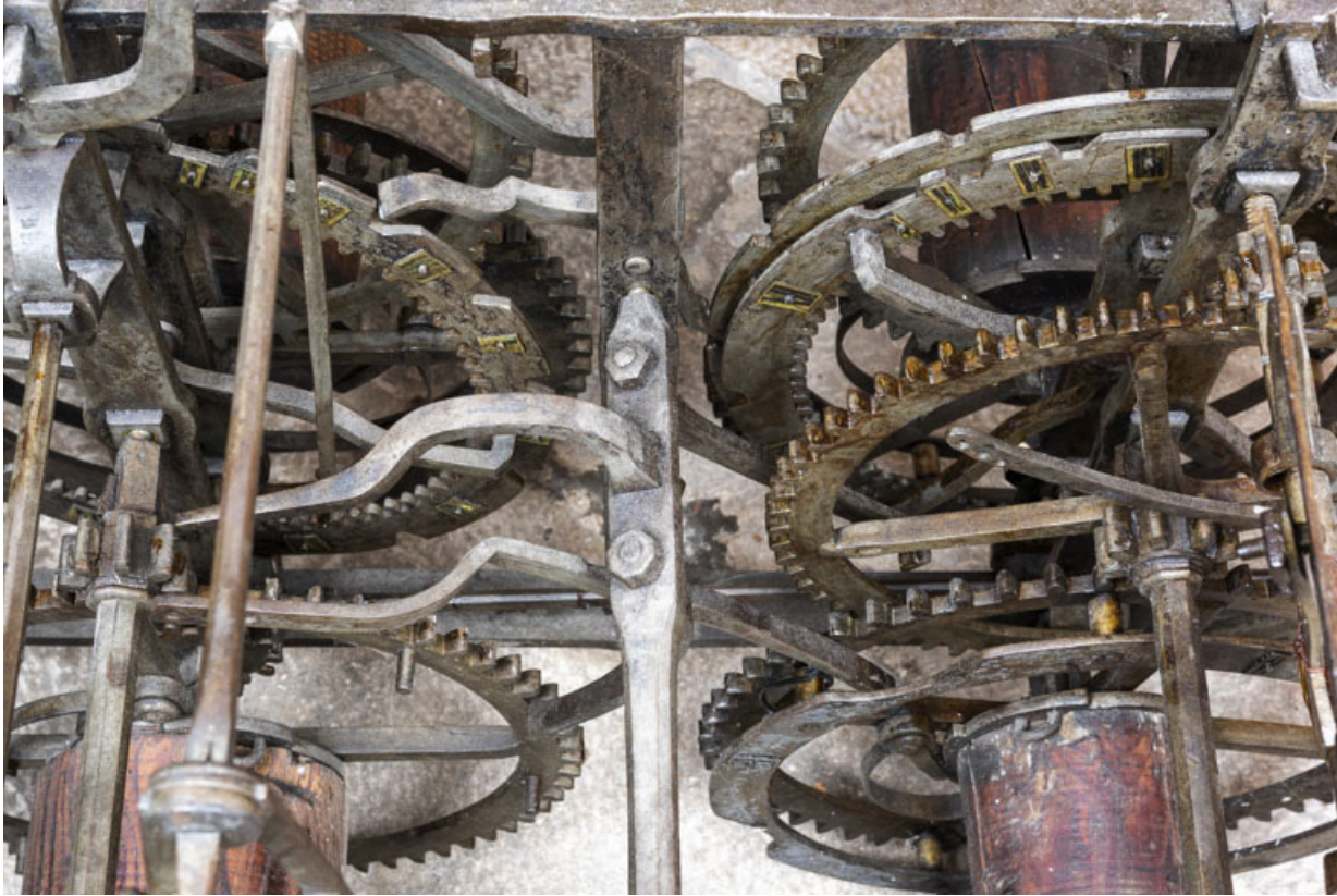
Roues de compte : vue plongeante.