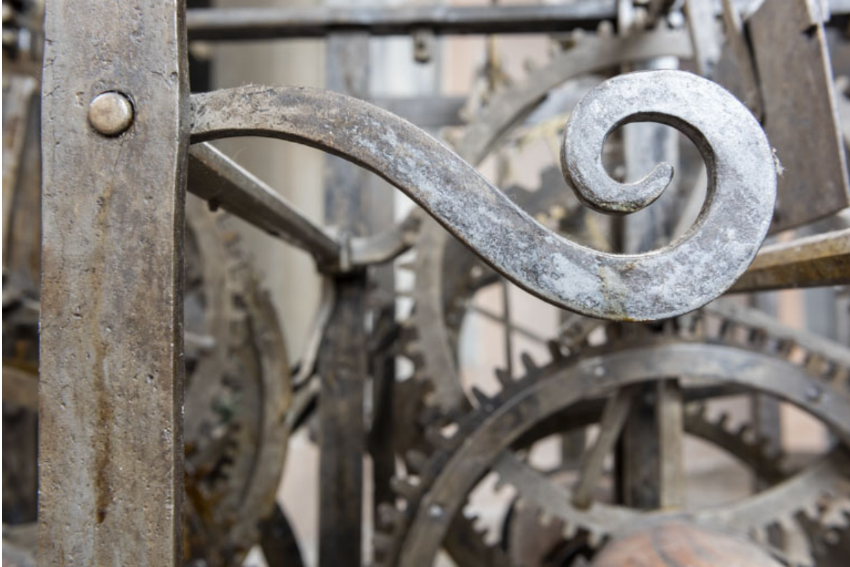
Volute à l'extrémité d'une tige mobile.