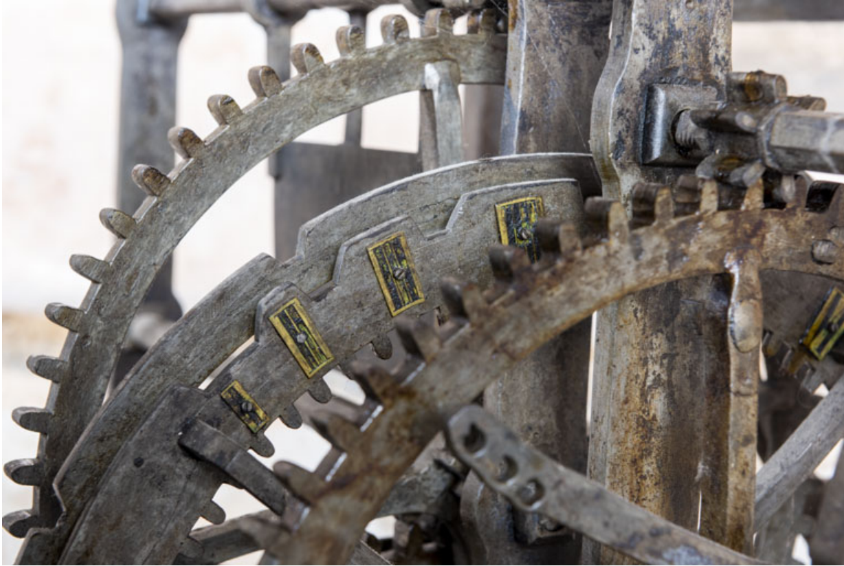
Corps arrière droit (sonnerie des quarts d'heure) : détail de la roue de compte. 39, Orgelet place de l' Eglise