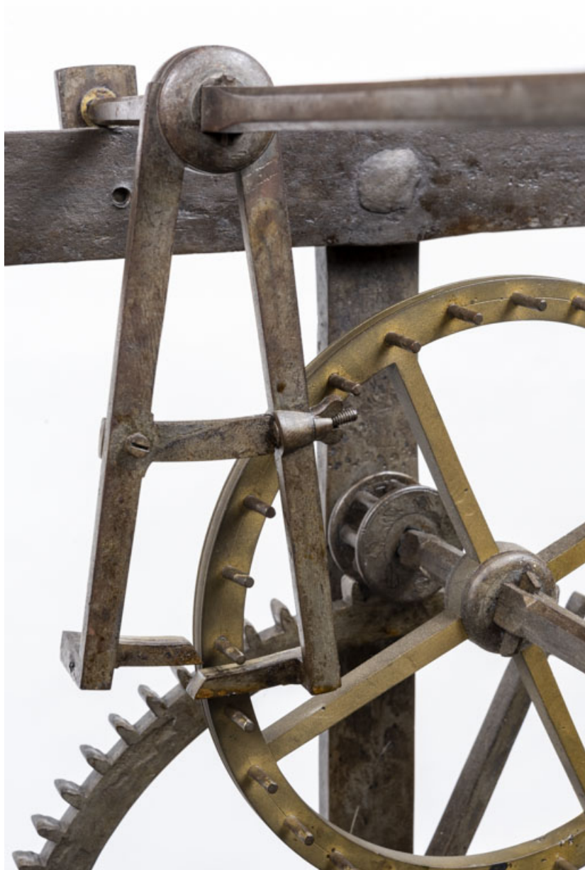
Echappement à chevilles : ancre et roue d'échappement.