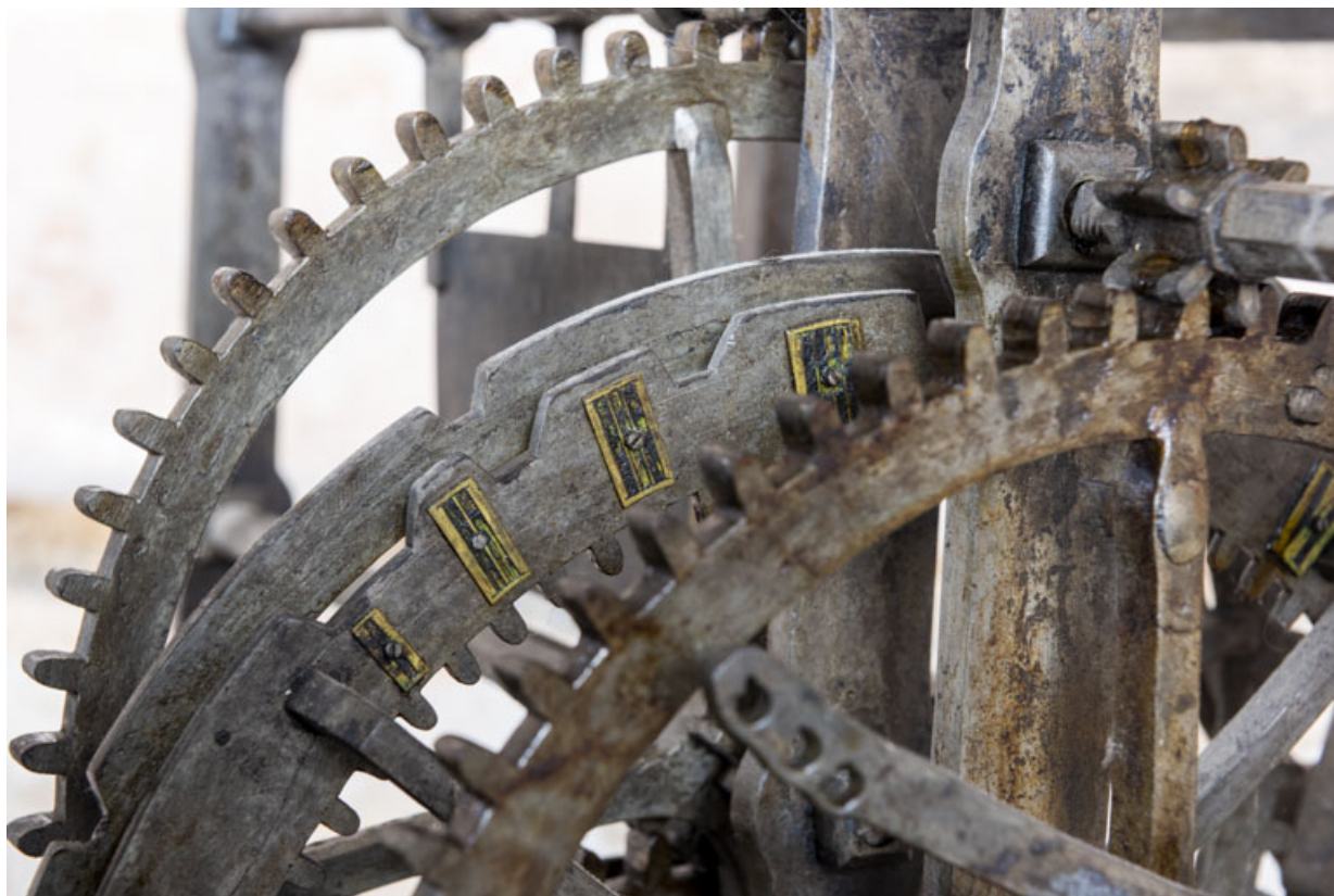
Corps arrière droit (sonnerie des quarts d'heure) : détail de la roue de compte. 39, Orgelet place de l' Eglise