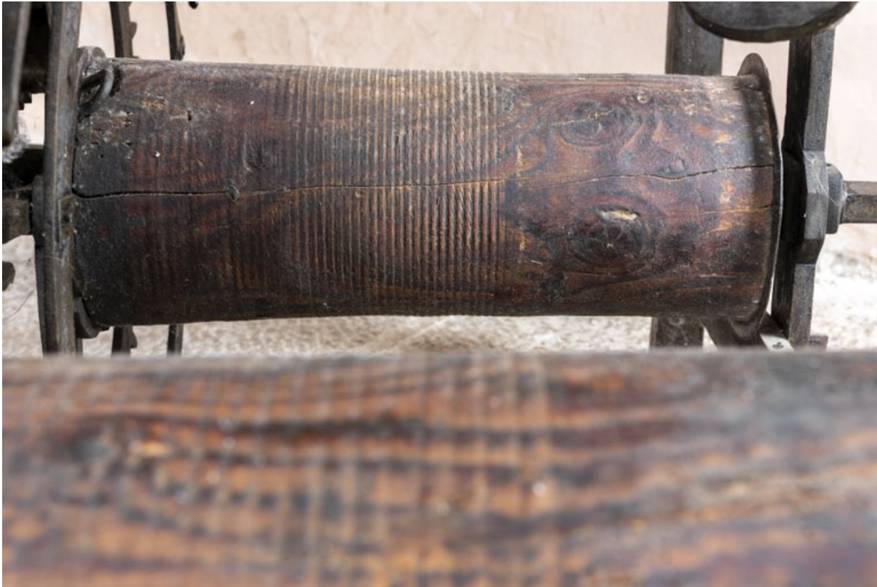
Corps arrière droit (sonnerie des quarts d'heure) : tambour en bois.