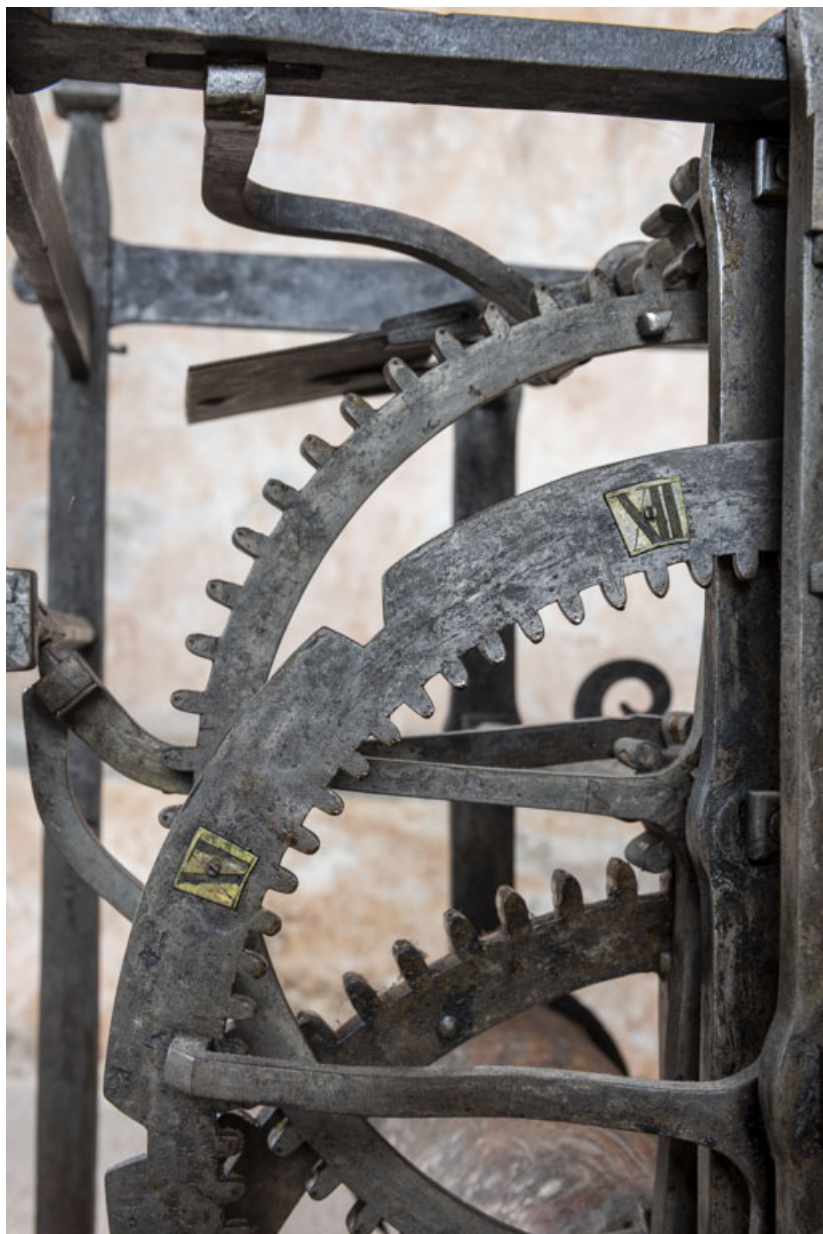
Corps avant gauche (sonnerie des heures) : détail de la roue de compte. 39, Orgelet place de l' Eglise