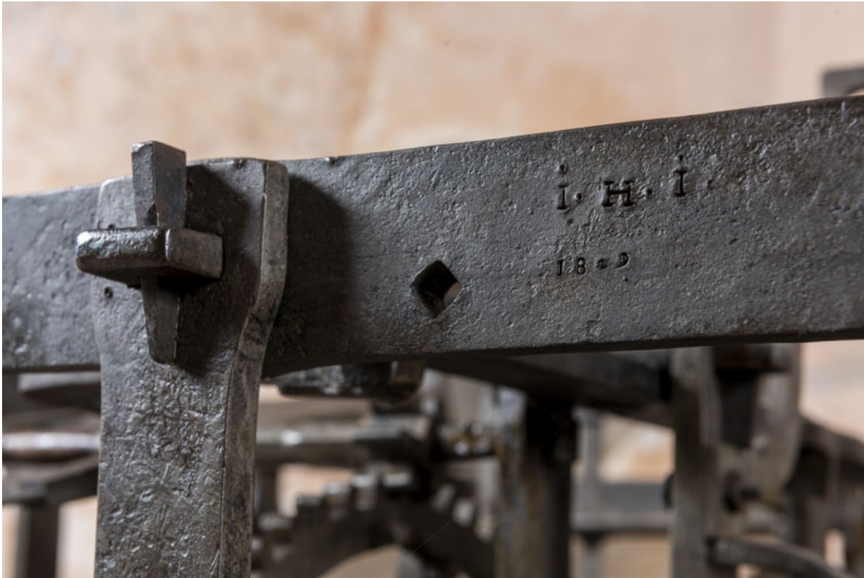
Face antérieure : inscription gravée sur le montant supérieur du corps avant droit (partage du temps). 39, Orgelet place de l' Eglise