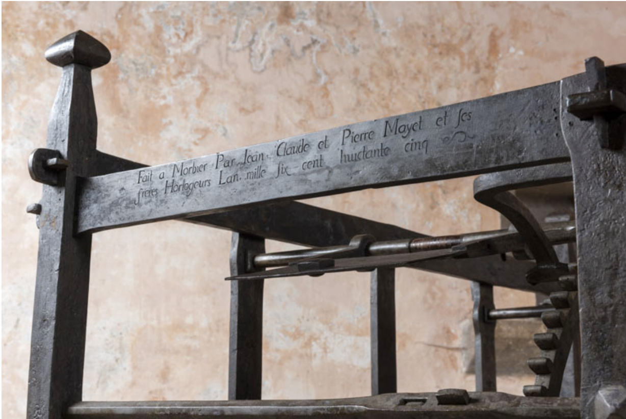
Face antérieure : inscription et date 1685, de trois quarts.