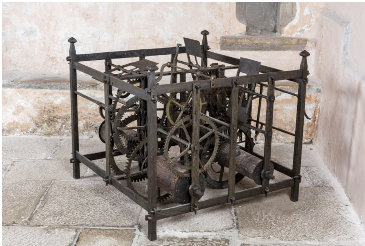
Vue d'ensemble, de trois quarts droite.