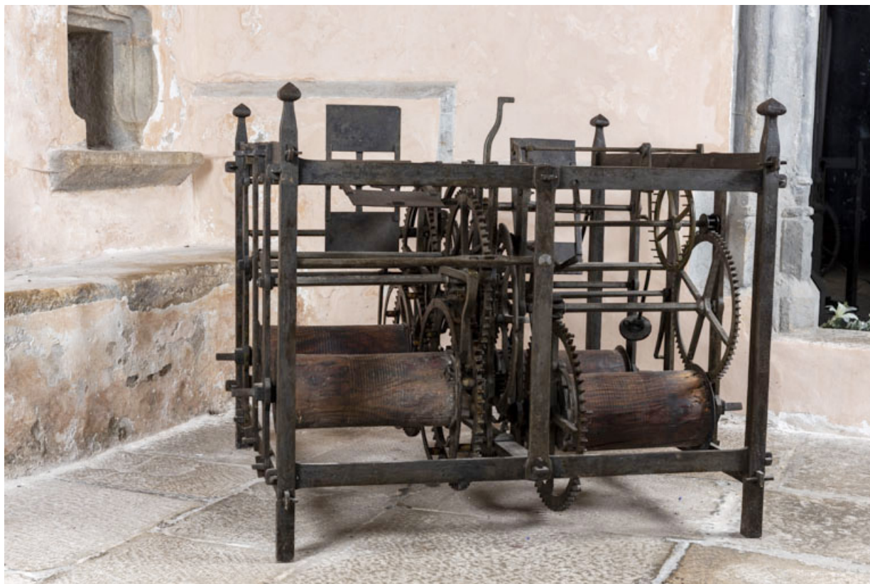
Face antérieure, de trois quarts gauche.