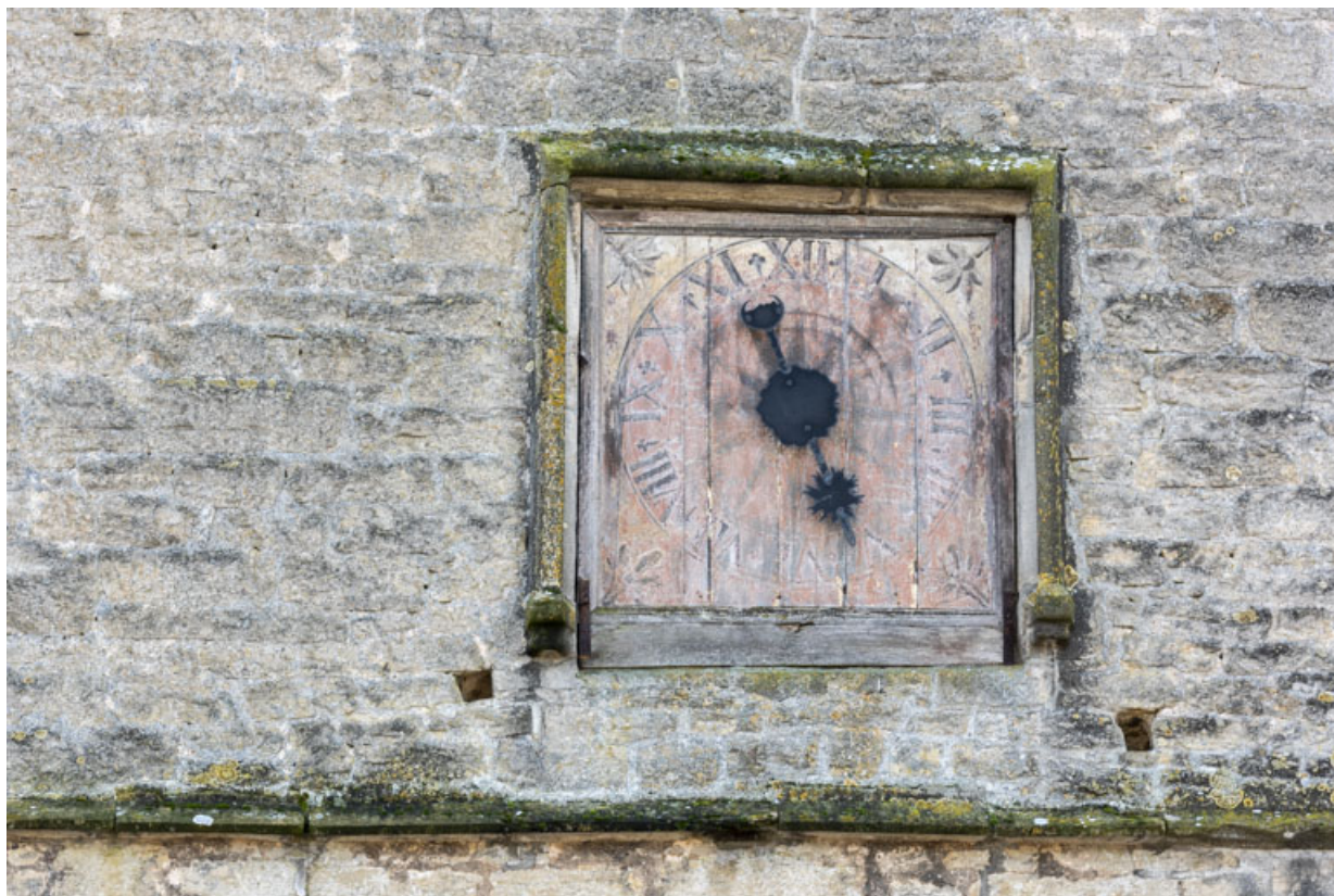
Cadran en bois et son aiguille.