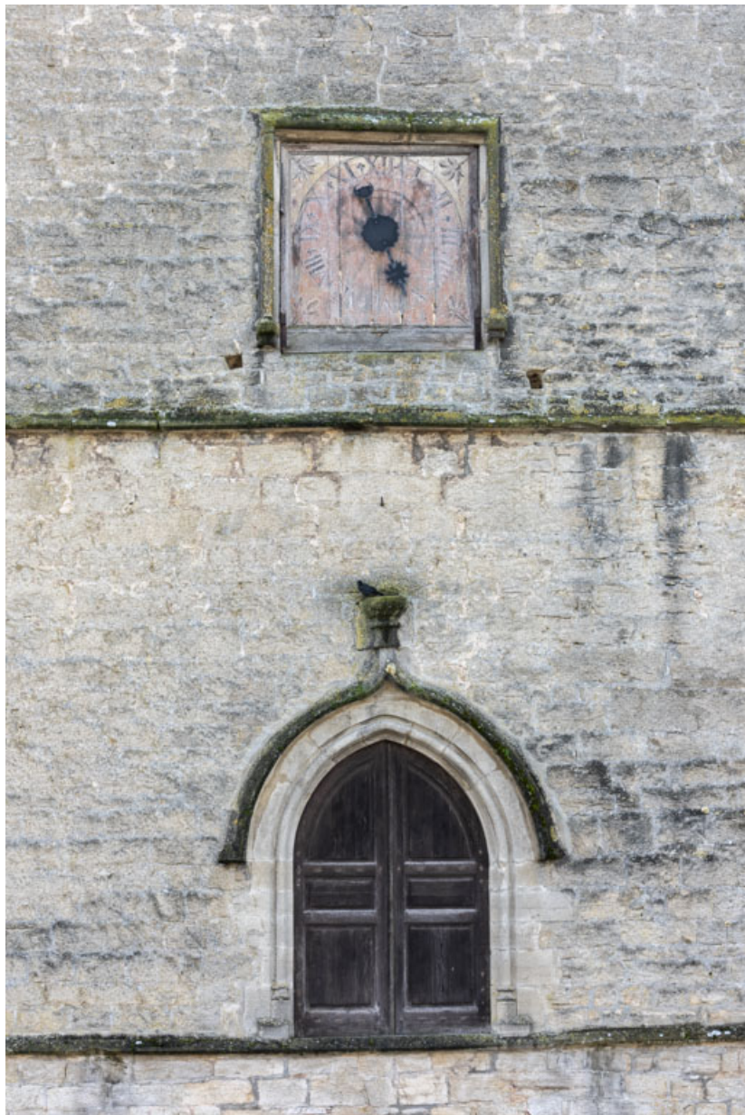
Vue d'ensemble du cadran en bois.