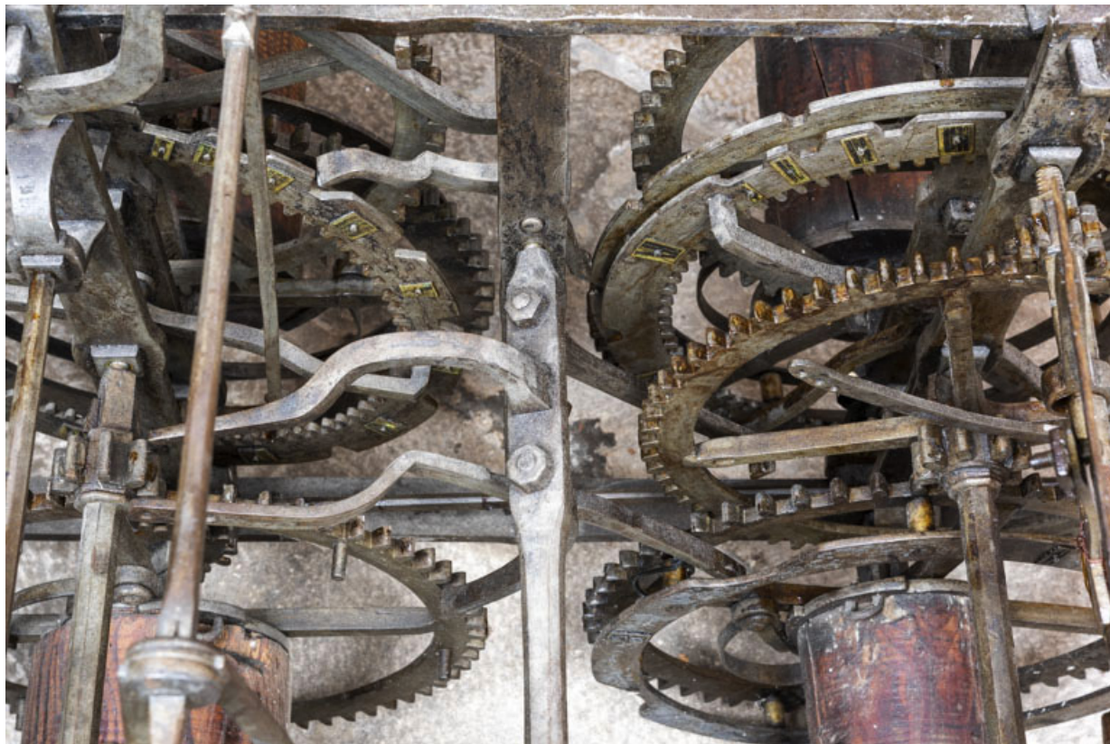
Roues de compte : vue plongeante. 39, Orgelet place de l' Eglise