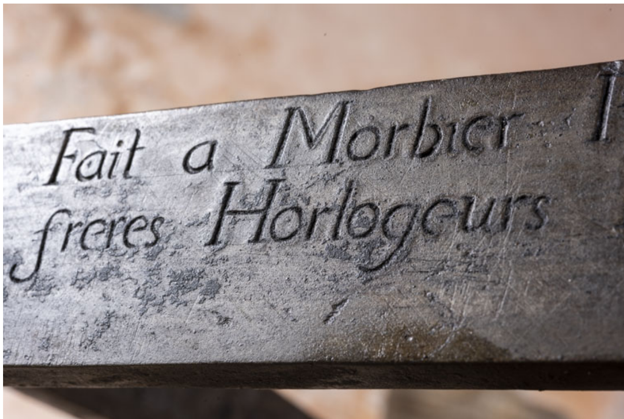
Face antérieure : détail de l'inscription.