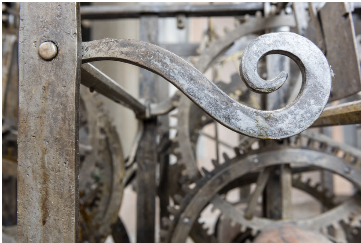
Volute à l'extrémité d'une tige mobile.