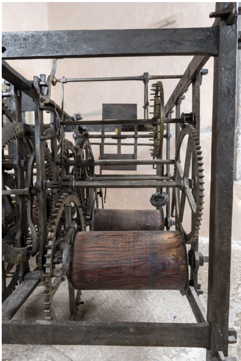
Corps avant droit (partage du temps), depuis la face antérieure.