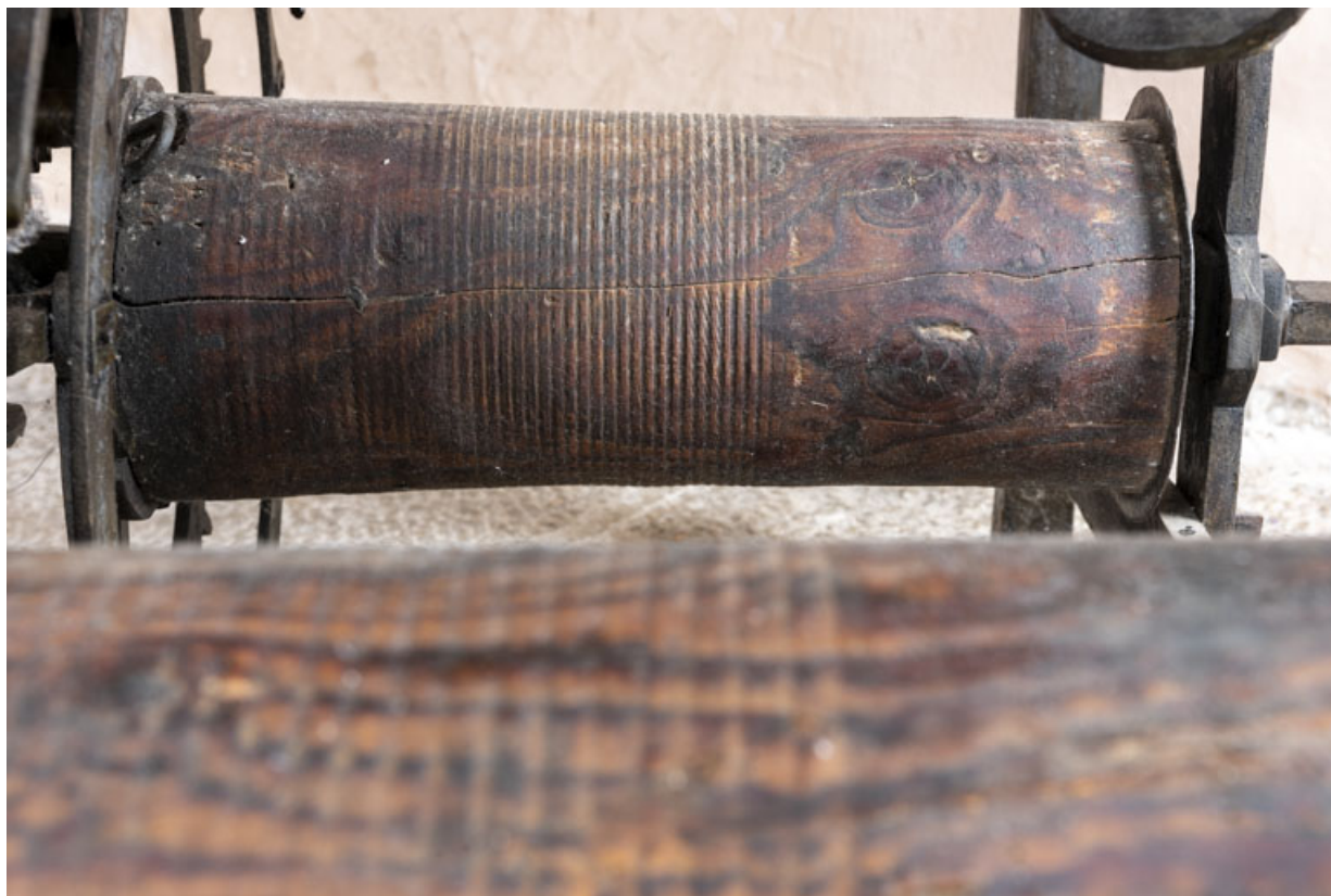
Corps arrière droit (sonnerie des quarts d'heure) : tambour en bois. 39, Orgelet place de l' Eglise