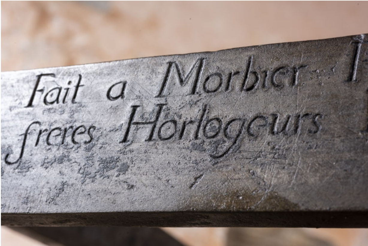
Face antérieure : détail de l'inscription.