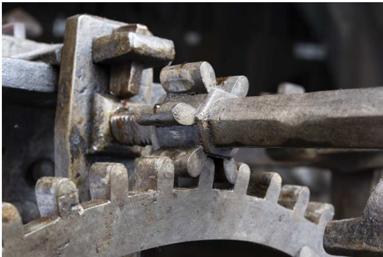
Roue dentée et pignon : détail de la denture.