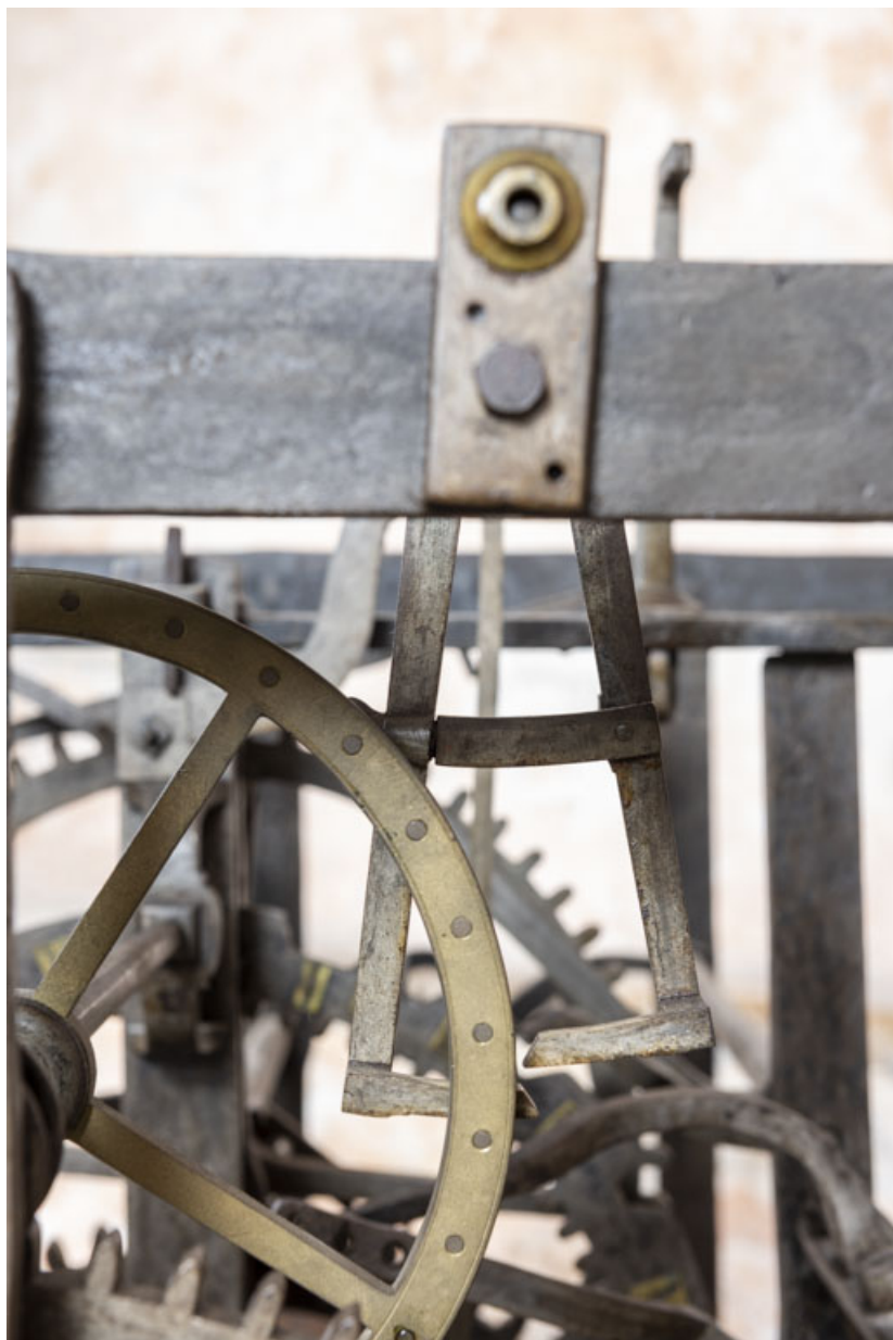
Echappement à chevilles : roue d'échappement au premier plan, en avant de l'ancre. 39, Orgelet place de l' Eglise