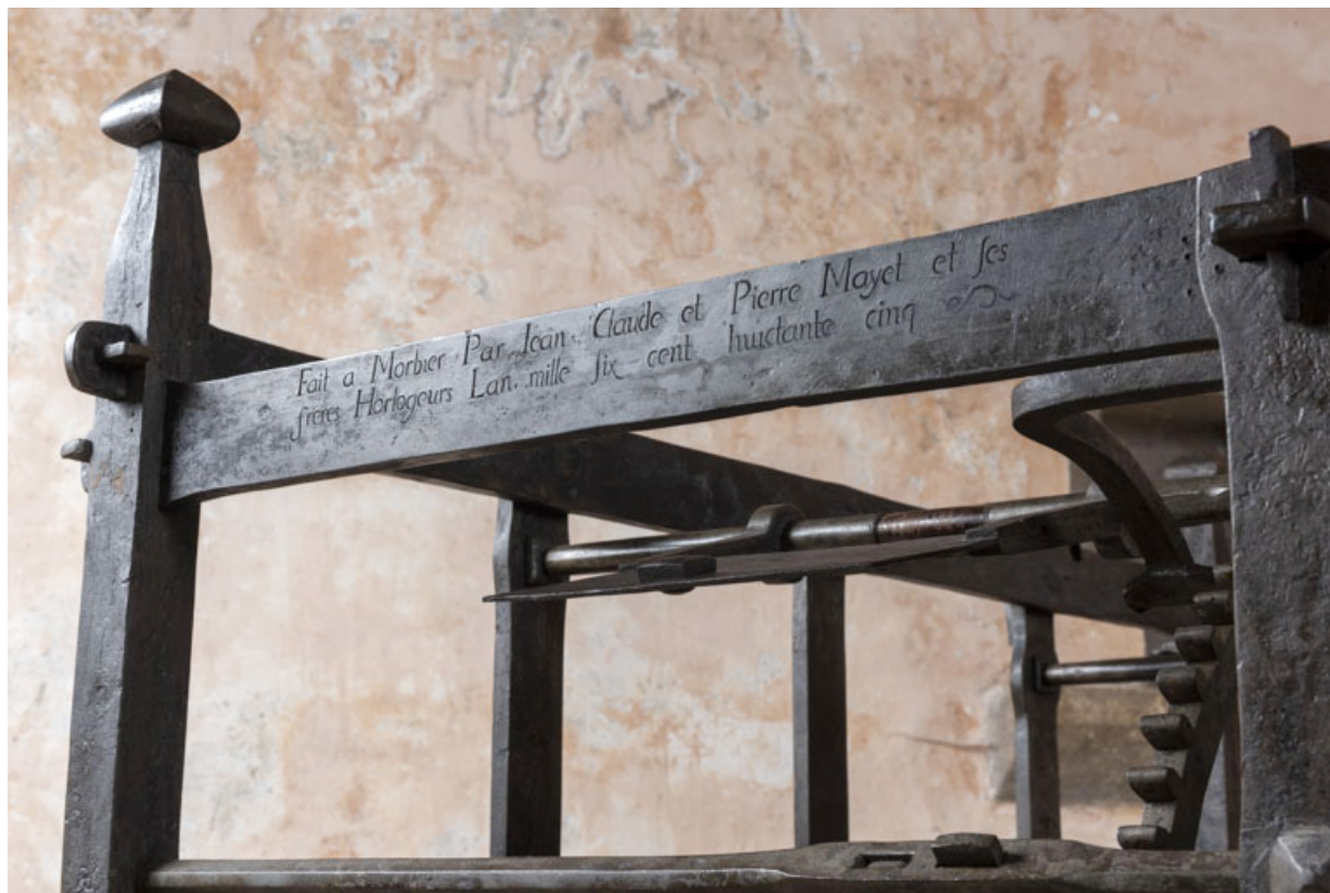
Face antérieure : inscription et date 1685, de trois quarts. 39, Orgelet place de l' Eglise