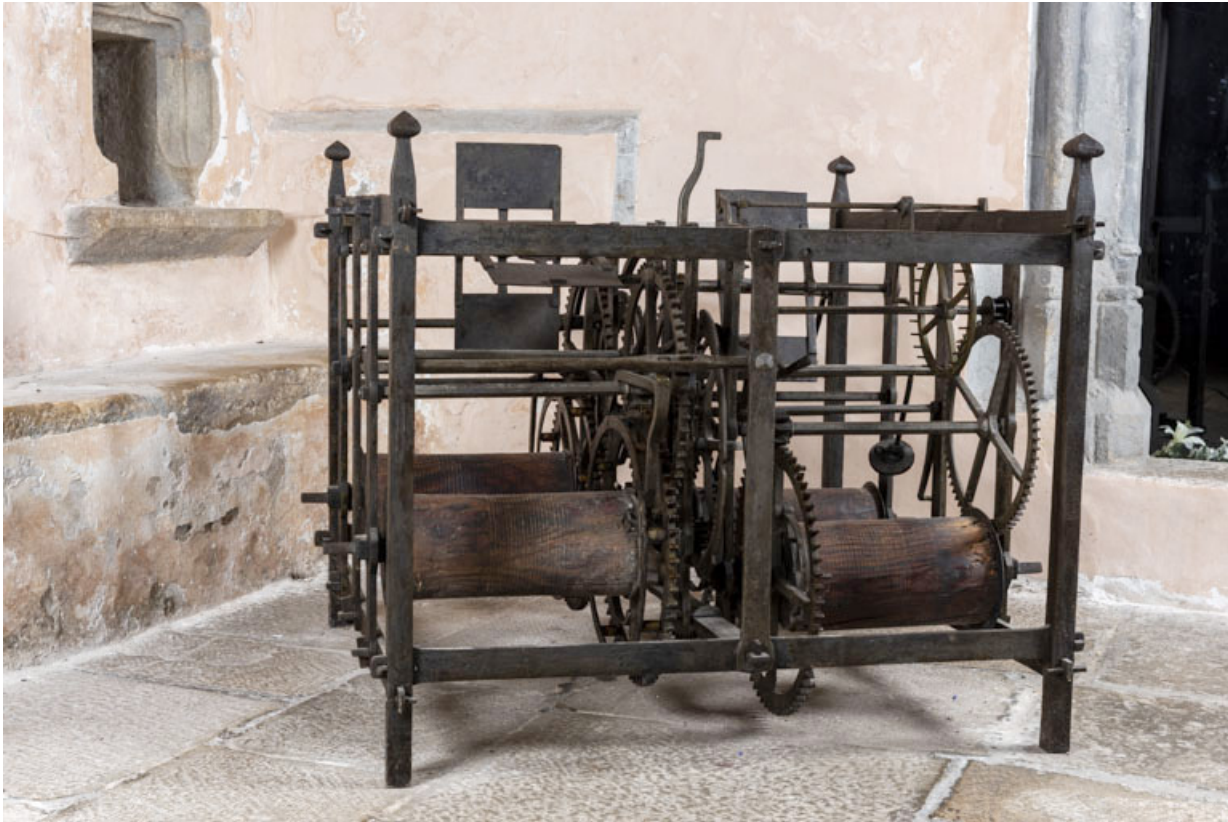
Face antérieure, de trois quarts gauche.