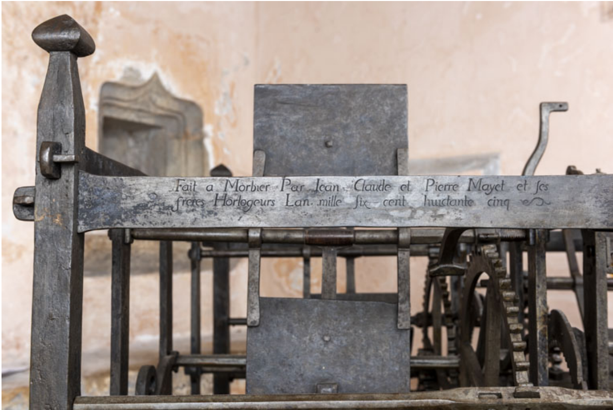
Face antérieure : inscription et date 1685.