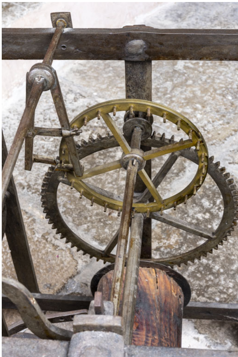
Corps avant droit (partage du temps) : échappement à chevilles, vu en plongée. La roue d'échappement (en laiton) est munie de chevilles qui interagissent avec l'ancre à gauche.