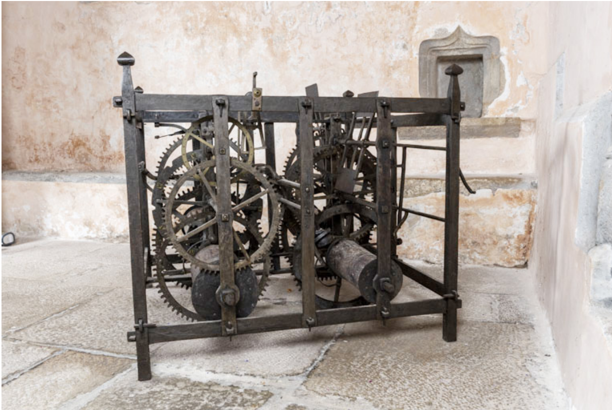
Face latérale droite.