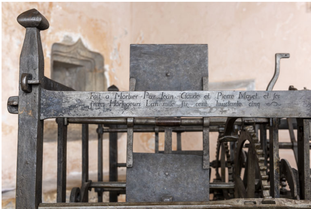
Face antérieure : inscription et date 1685.