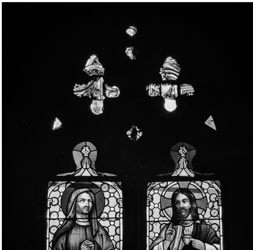
Vue d'ensemble : fragments d'architecture, tête d'homme.