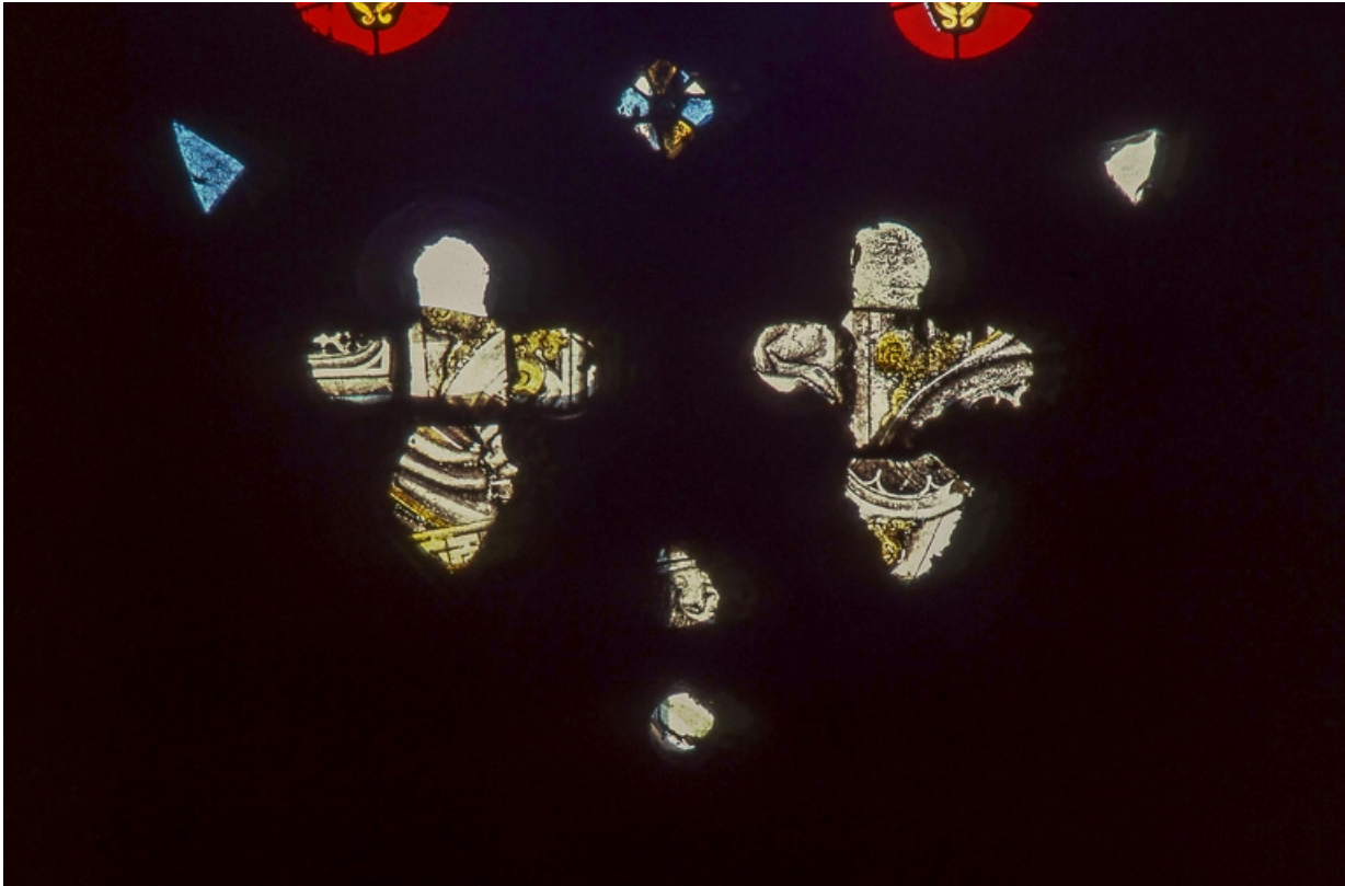
Vue d'ensemble : fragments d'architecture, tête d'homme. 39, Lains