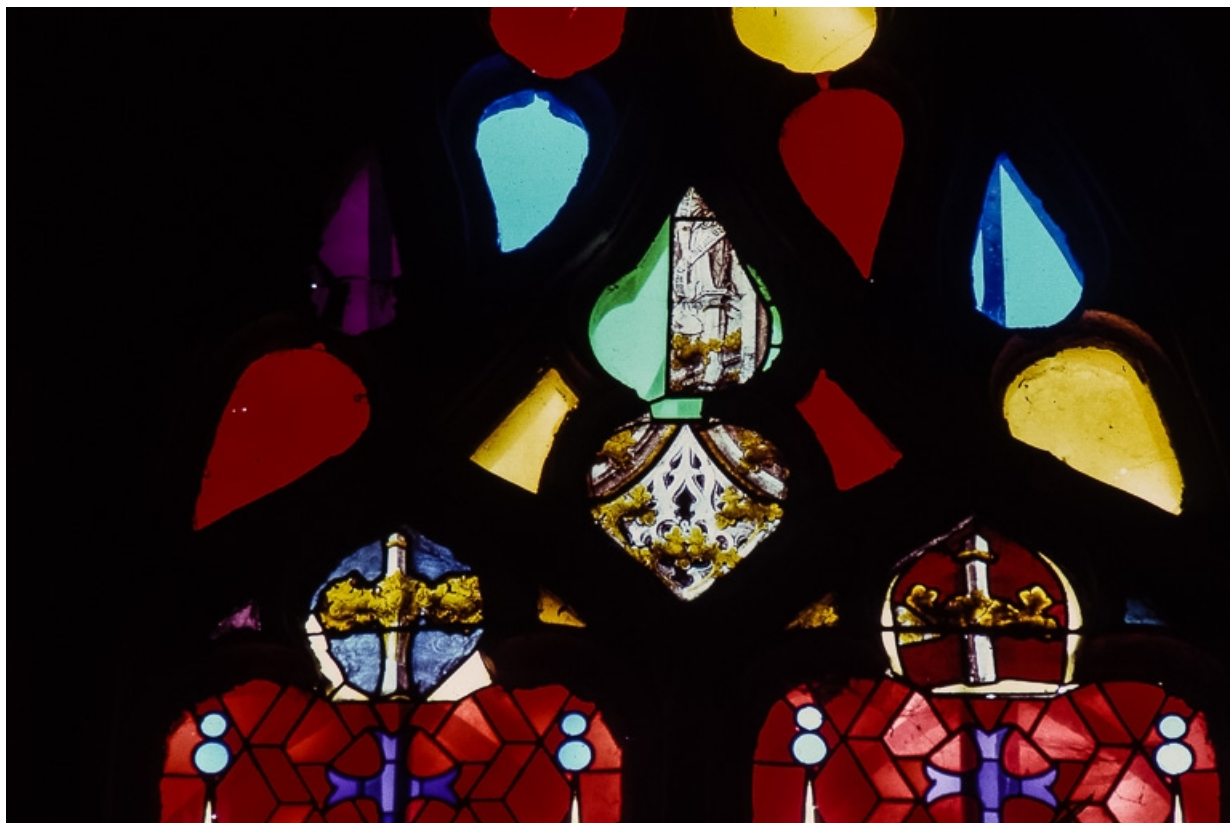
Tympan et têtes de lancettes : motifs de dais d'architecture, choux frisés et fragments d'un petit personnage. 39, Chaux-des-Crotenay