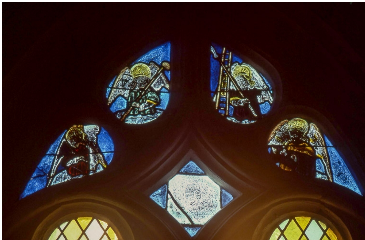
Vue d'ensemble du tympan : linge de Véronique, anges tenant les instruments de la Passion. 39, Charnod