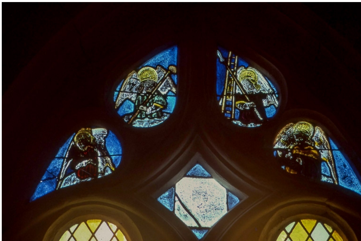
Vue d'ensemble du tympan : linge de Véronique, anges tenant les instruments de la Passion. 39, Charnod