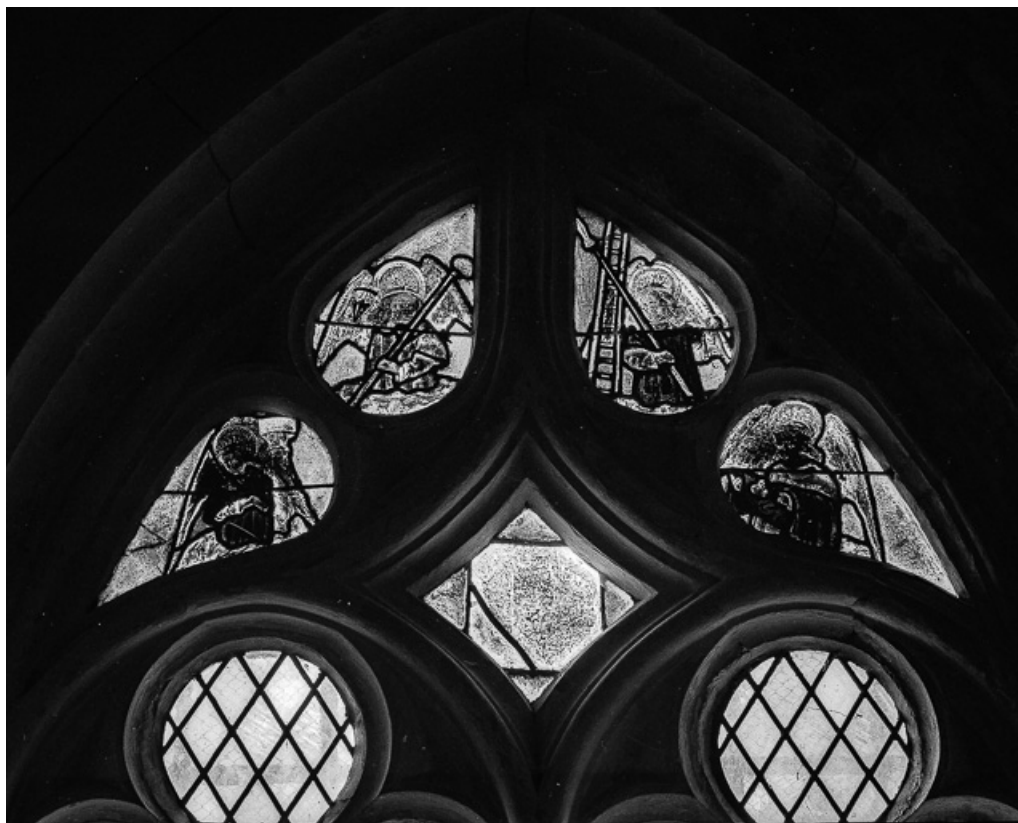
Vue d'ensemble du tympan : linge de Véronique, anges tenant les instruments de la Passion. 39, Charnod