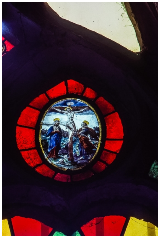
Calvaire (tête de lancette droite). 39, Bersaillin