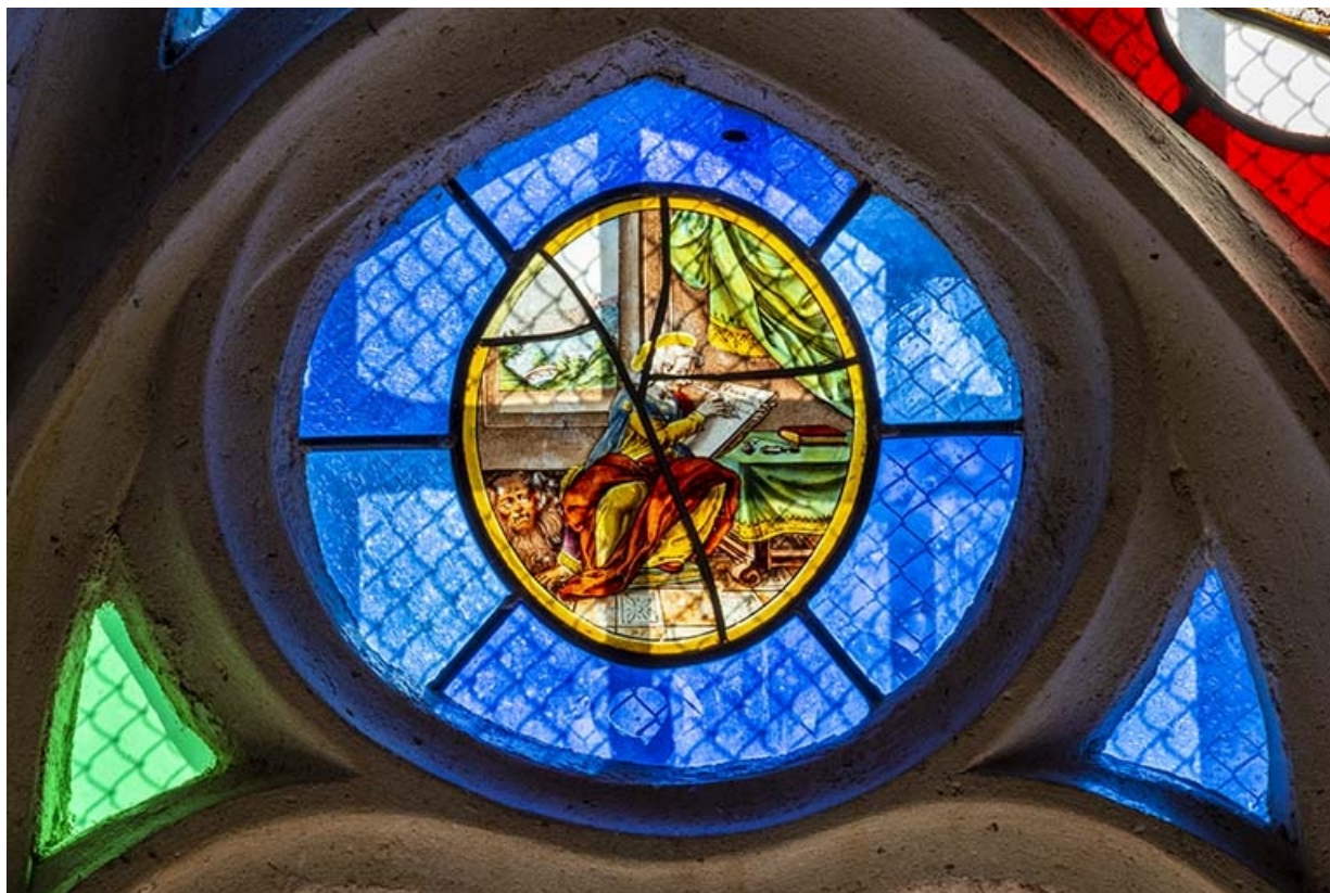
Saint Jérôme écrivant avec le lion (tête de lancette gauche). 39, Bersaillin