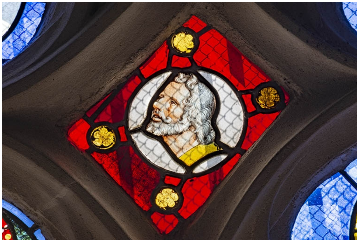
Tête de Moïse (mouchette droite). 39, Bersaillin