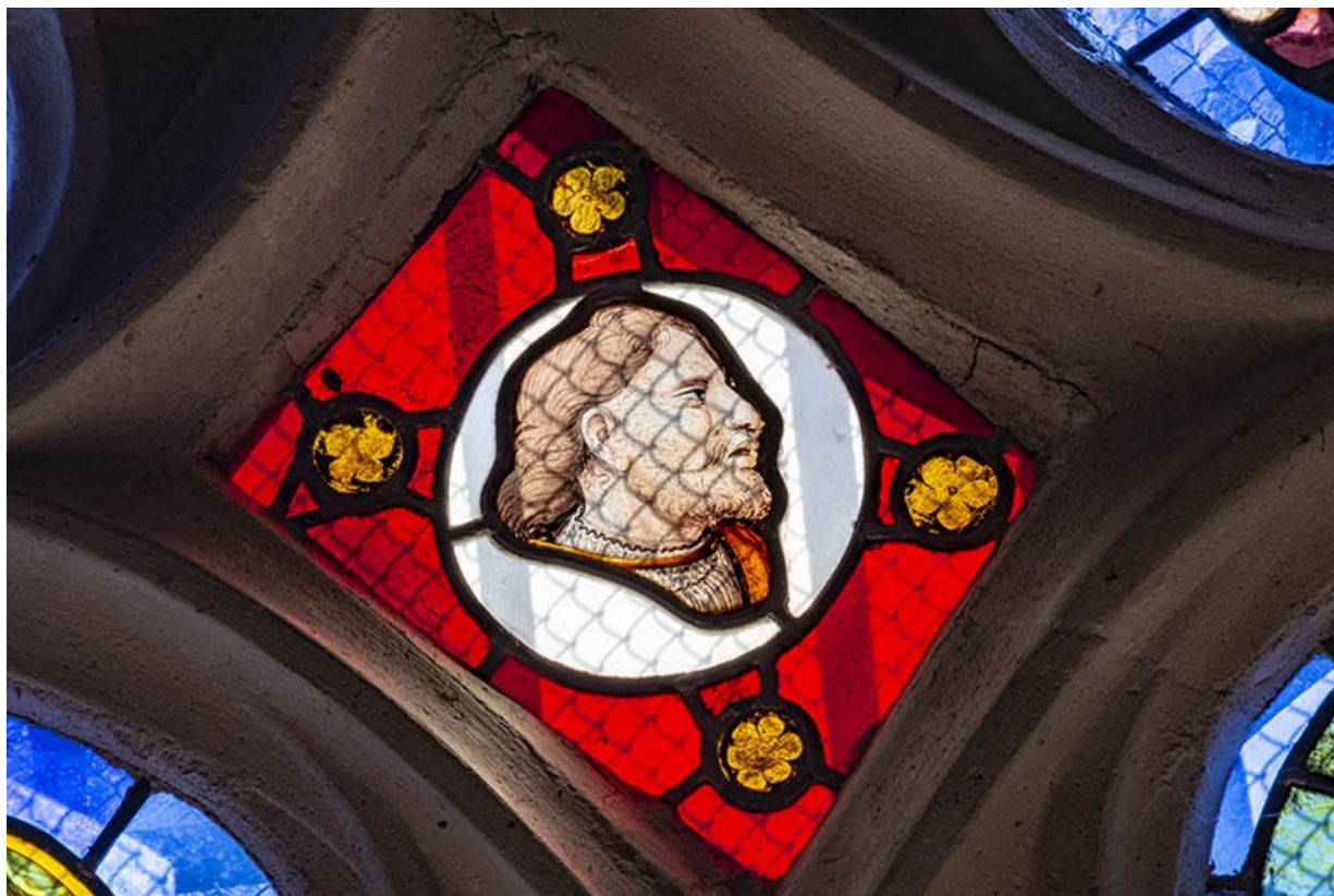
Tête d'homme barbu de profil (mouchette gauche). 39, Bersaillin