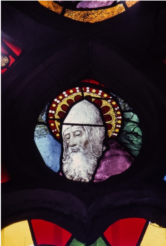
Tête de saint barbu et auréolé (tête de lancette centrale). 39, Bersaillin