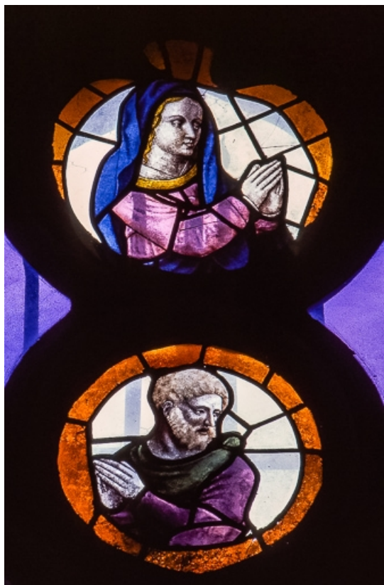
Bustes de la Vierge et d'un apôtre (soufflets). 39, Bersaillin