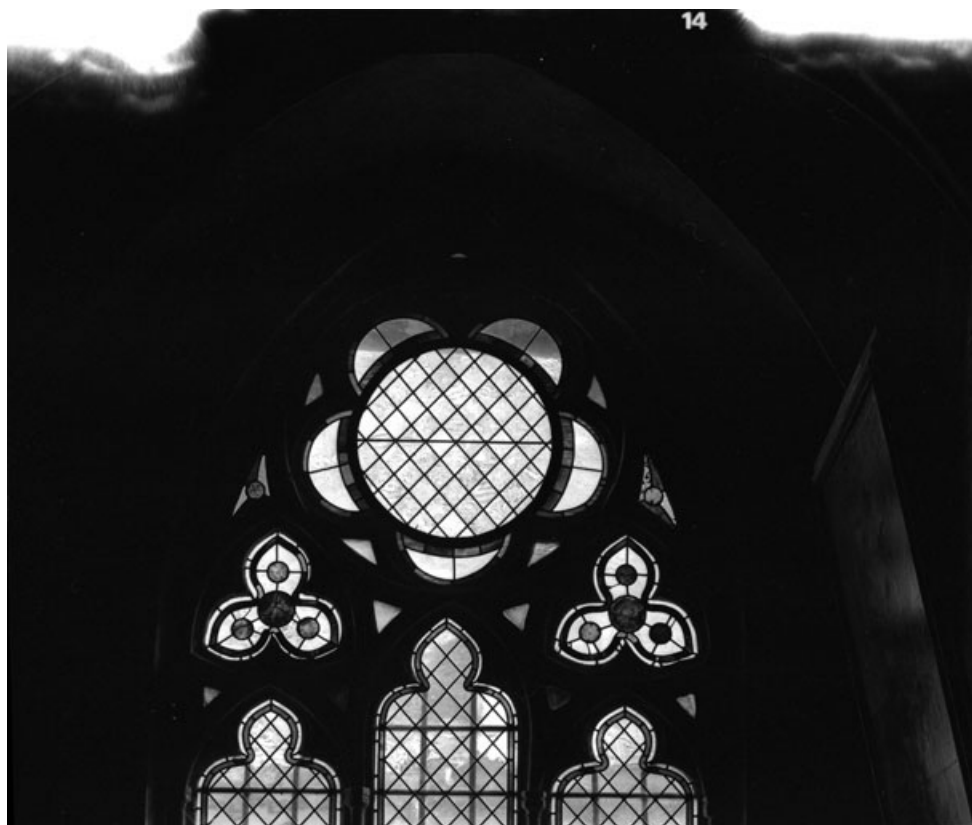
Partie supérieure de la baie.