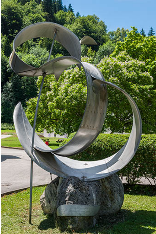
Vue d'ensemble avec cartouche.