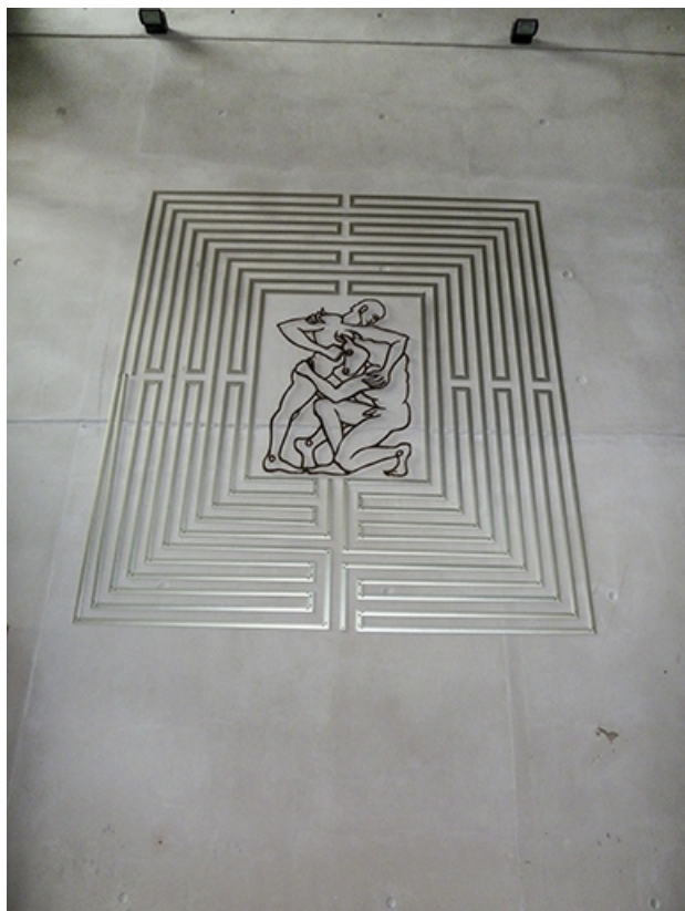
labyrinthe du temps, au centre le Minotaure.