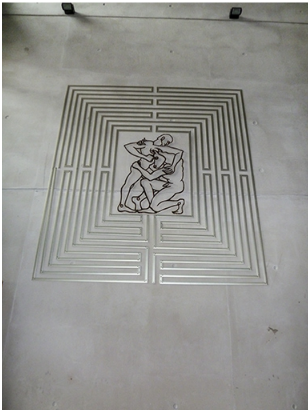
labyrinthe du temps, au centre le Minotaure.