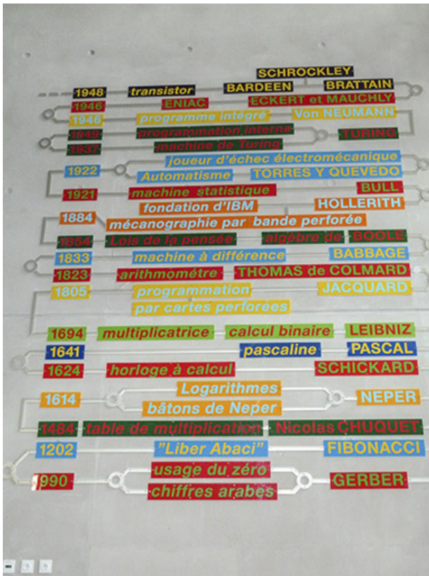
labyrinthe des scientifiques