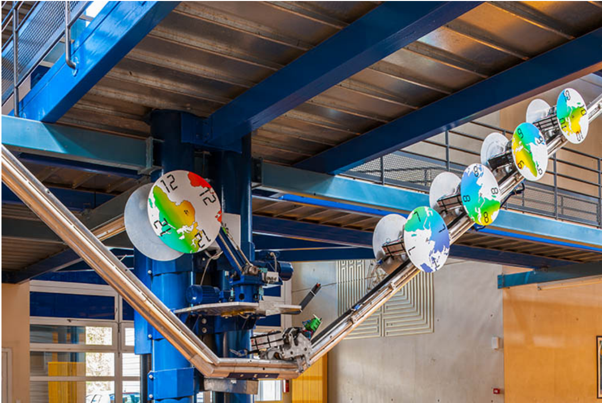
Mécanisme avec heures des différents continents.