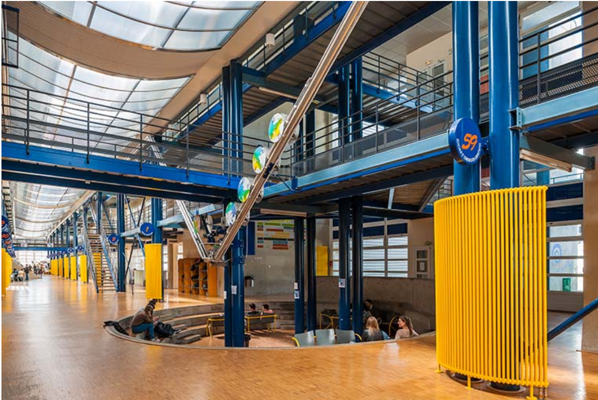
Horloge : vue d'ensemble.