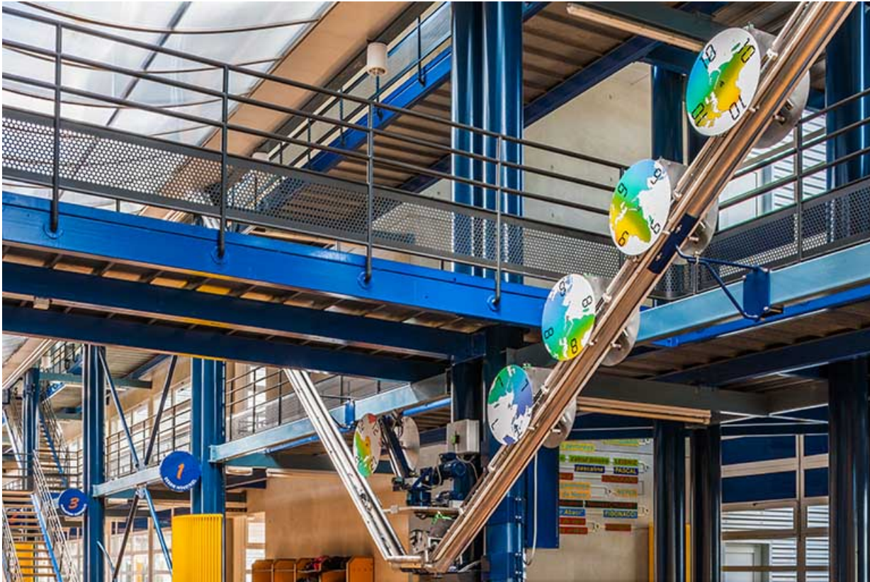
Horloge : détail mécanisme.