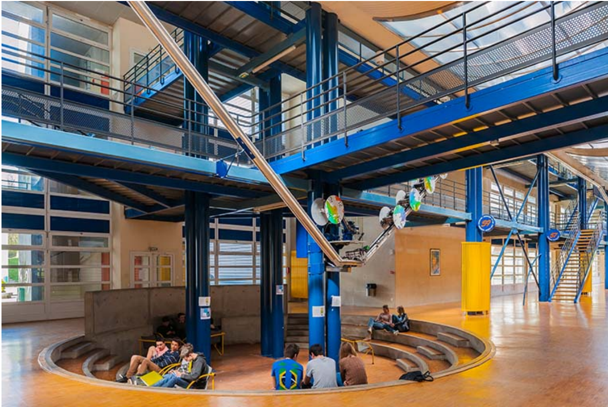
Pied de l'horloge de l'espace : espace détente.