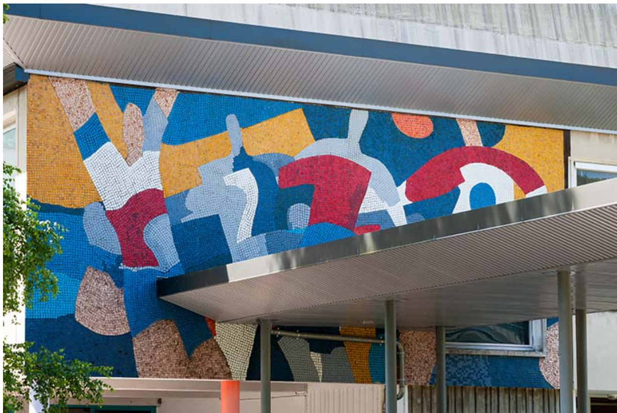
Le ballon : vue trois quart.