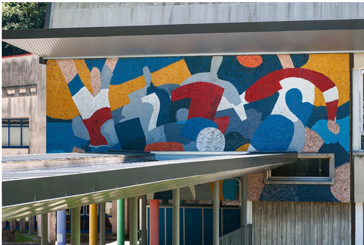
Le ballon : vue générale.