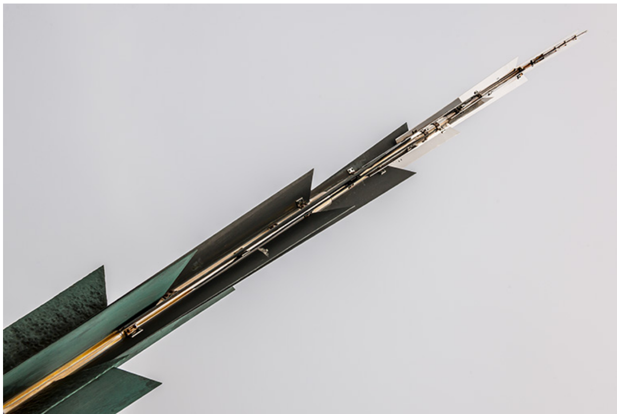
Détail de la flèche.