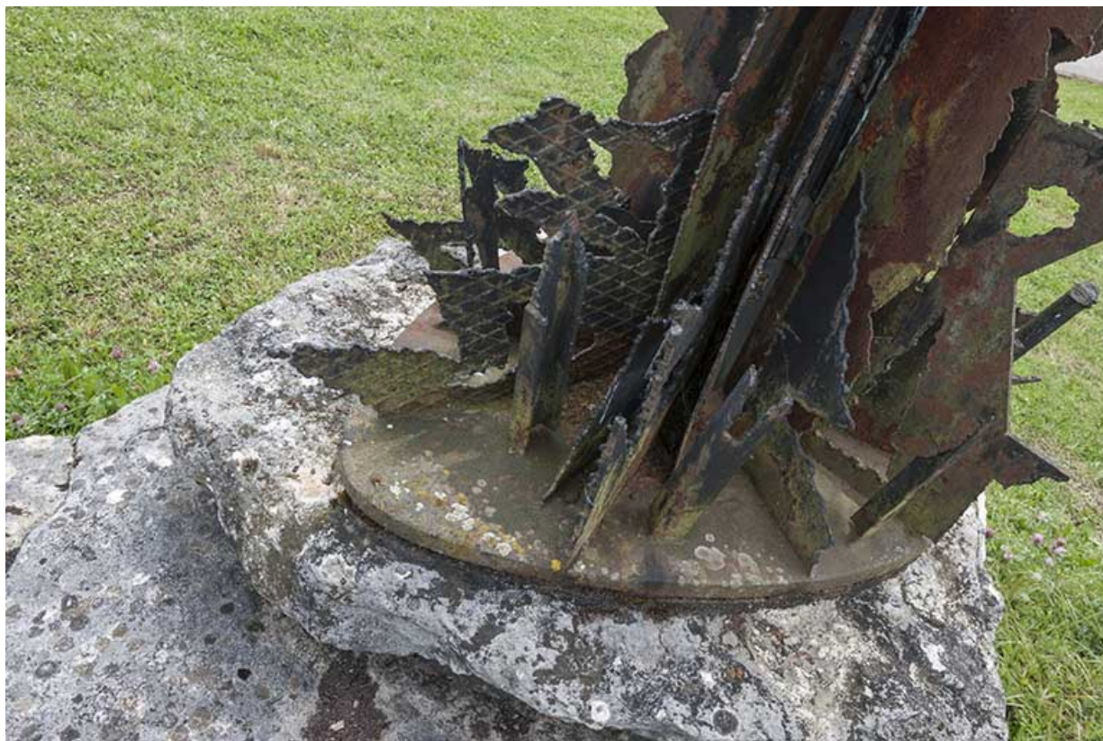
Détail du socle