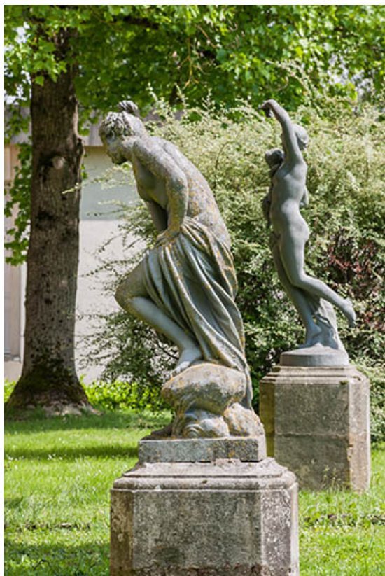
Groupe de sculptures : Vénus au bain et le Sommeil.