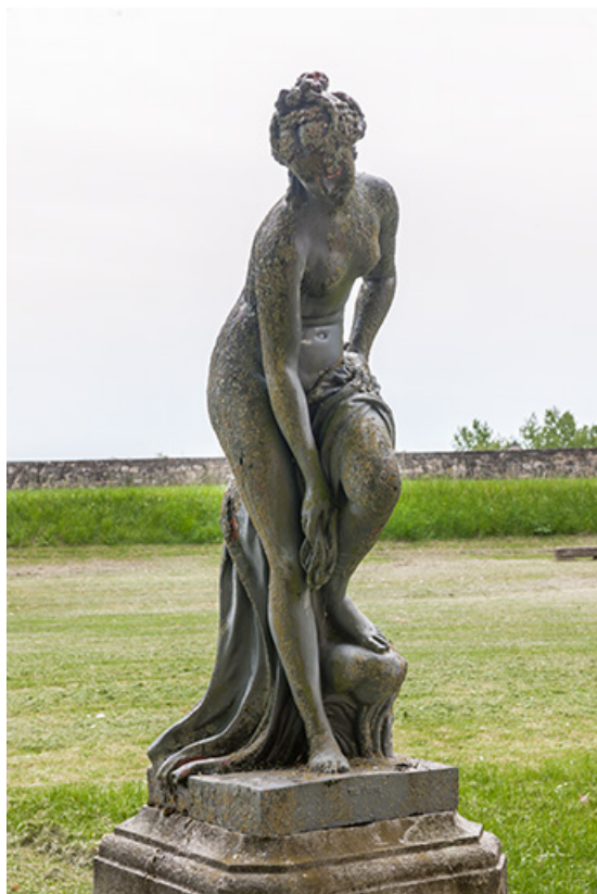
Vénus au bain, vue de trois quart.