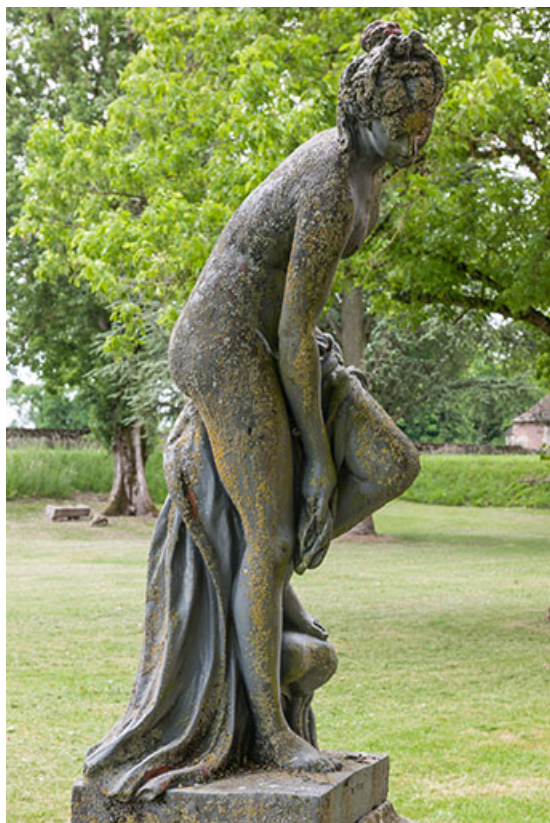
Vénus au bain , vue de profil.