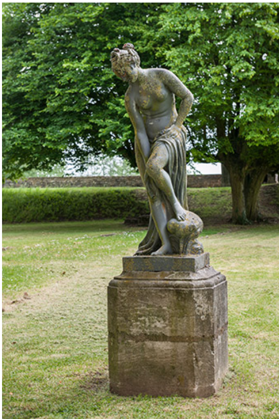
Vénus au bain, vue de face.