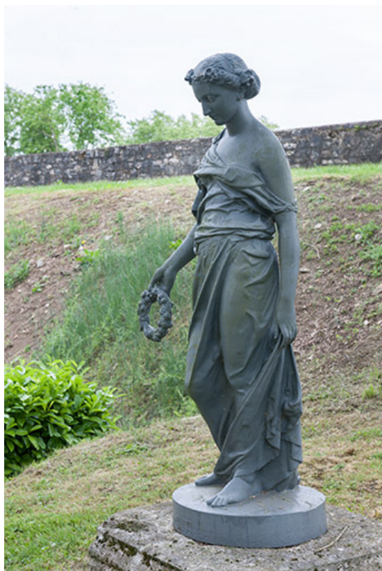
Le Printemps , vue de profil.