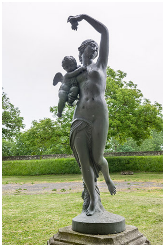
Le Sommeil, vue de face.