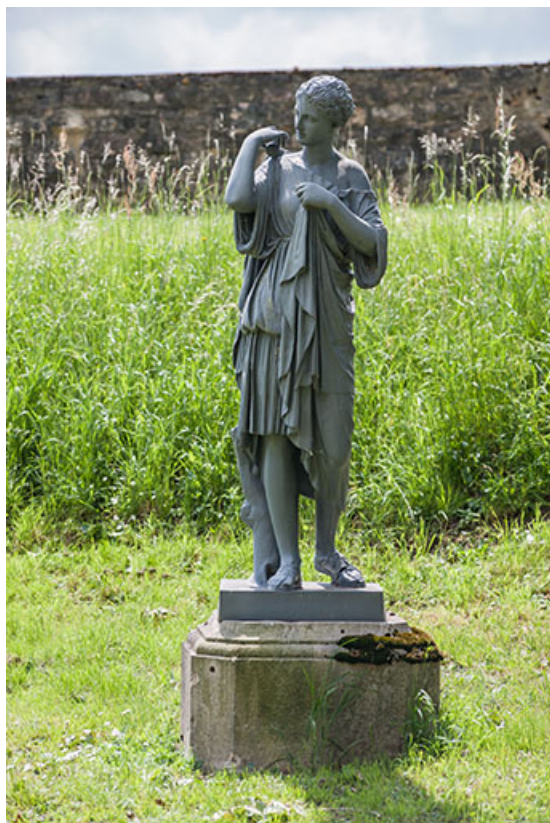
Diane de Gabies, vue de face.