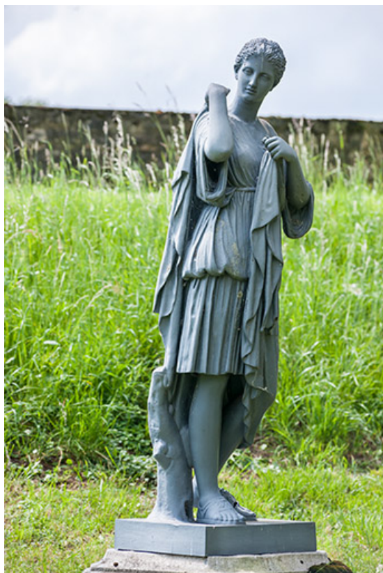
Diane de Gabies, vue de trois quart.