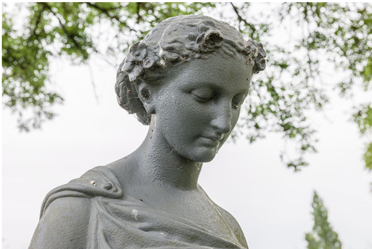
Le Printemps, détail de la tête.