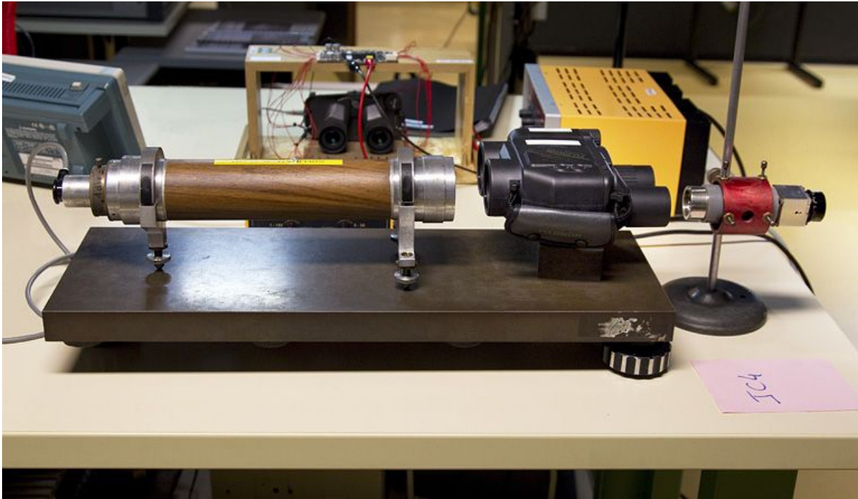
Exemple de montage réalisable lors de travaux pratiques. Destiné à tester l'optique de jumelles du commerce, ce montage associe une lunette à droite et un collimateur à gauche.