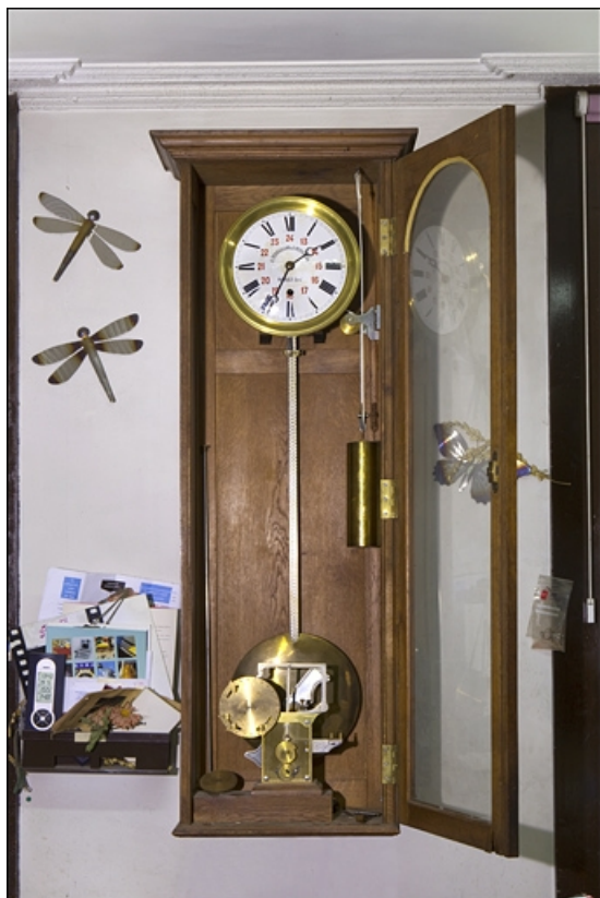
Vue d'ensemble, de face.