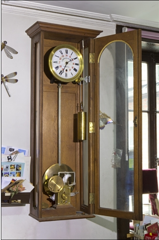
Vue d'ensemble, de trois quarts.