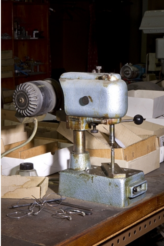
Machine n° 0992.