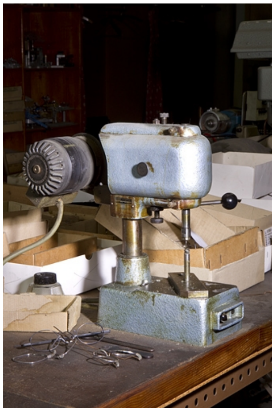
Machine n° 0992.