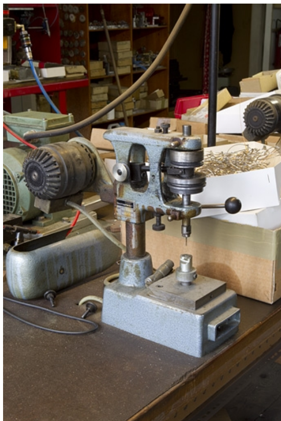
Machine n° 1187, carter de protection ôté. 39, Morez, 66 rue de la République