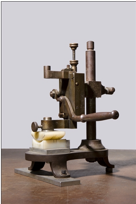
Machine à cintrer les faces, à coulisseau vertical (détournée).