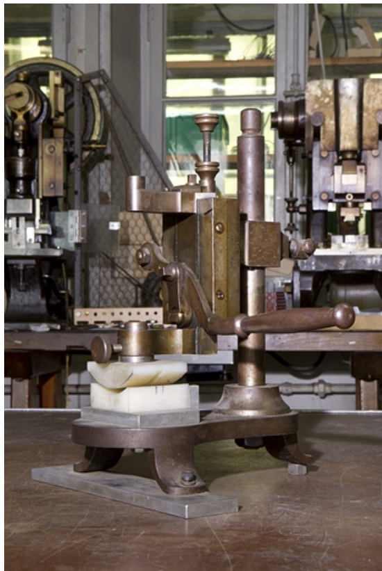
Machine à cintrer les faces, à coulisseau vertical.