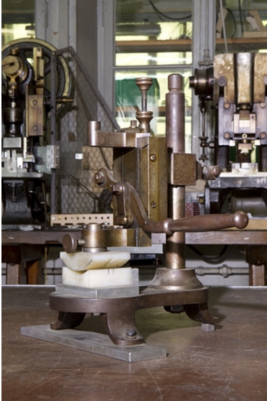
Machine à cintrer les faces, à coulisseau vertical.