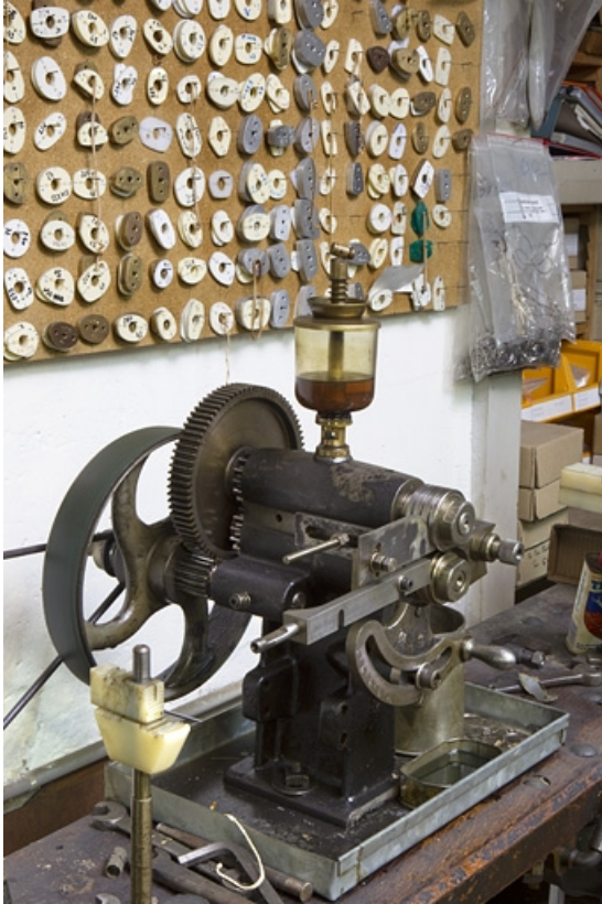
Les cylindres, vus de trois quarts gauche.