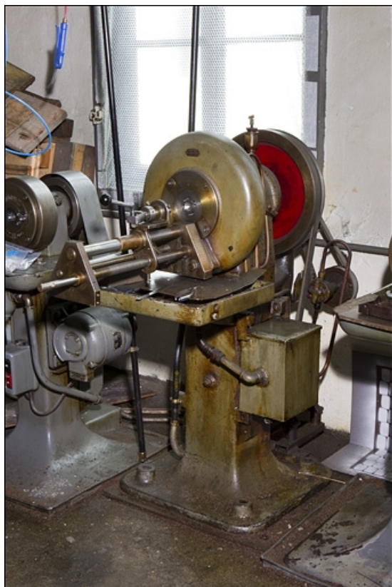
Machine Chanay et Maitrot.