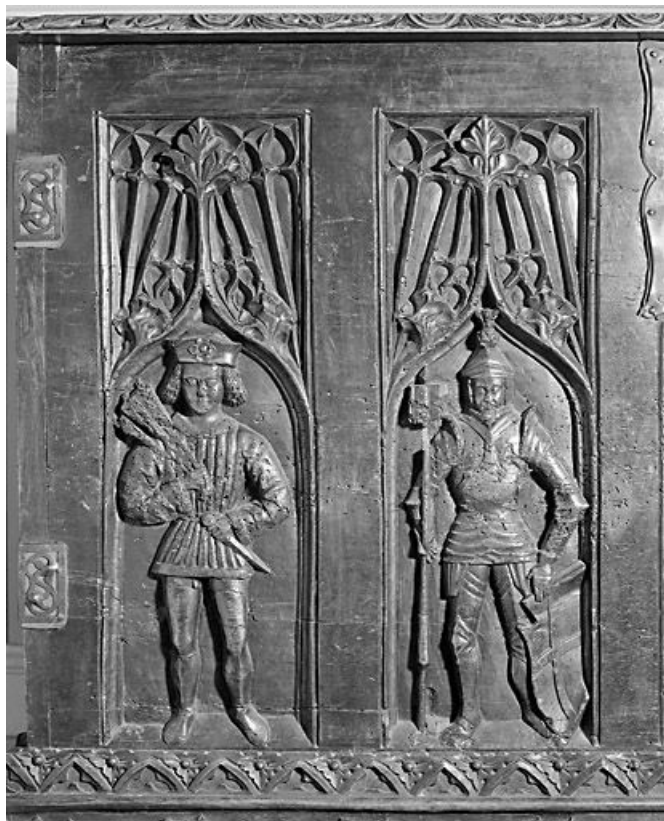
Coffre de la collection Jourdain : personnages sculptés à gauche. Collection du musée de la Lunette, Morez. 39, Morez place Jean Jaurès