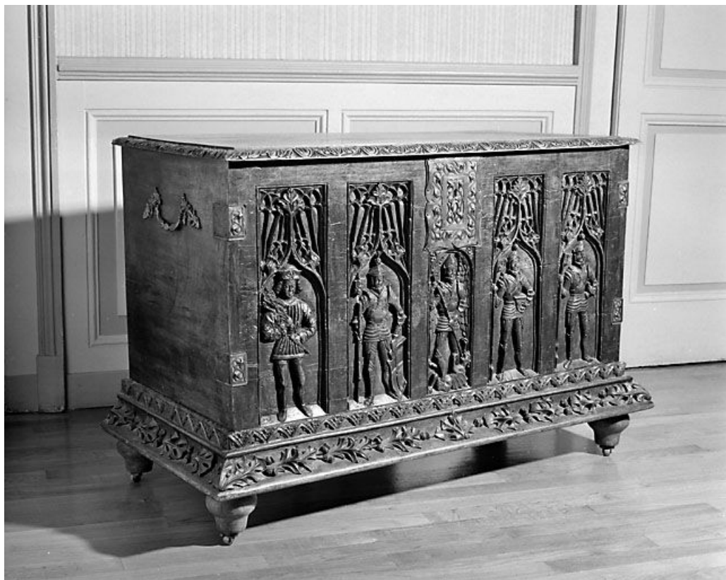
Coffre de la collection Jourdain : vue de trois quarts gauche. Collection du musée de la Lunette, Morez. 39, Morez place Jean Jaurès