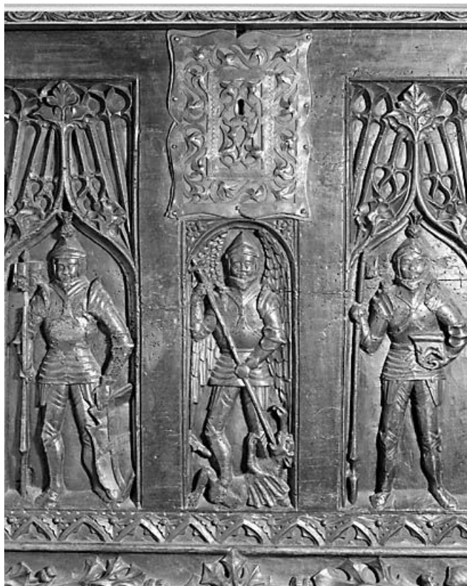
Coffre de la collection Jourdain : personnages sculptés au centre. Collection du musée de la Lunette, Morez. 39, Morez place Jean Jaurès