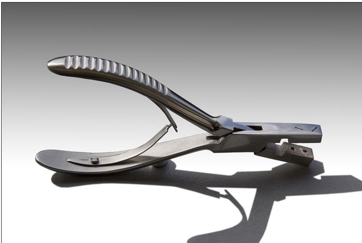
Pince récente (vue plongeante).