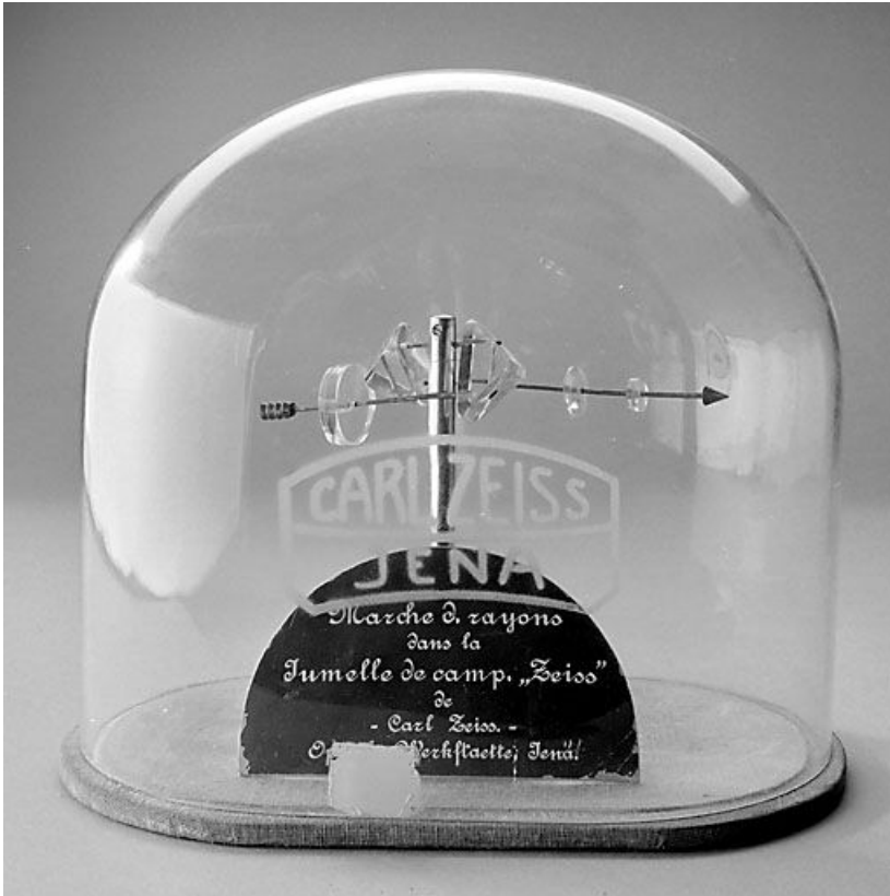
Vue d'ensemble, cloche en place.