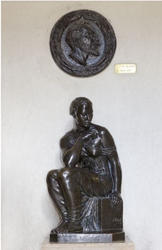
Vue d'ensemble rapprochée.