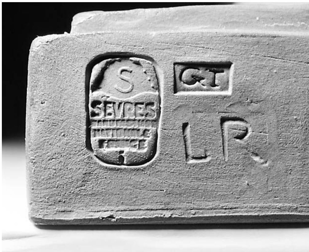
Marque de la Manufacture de Sèvres.