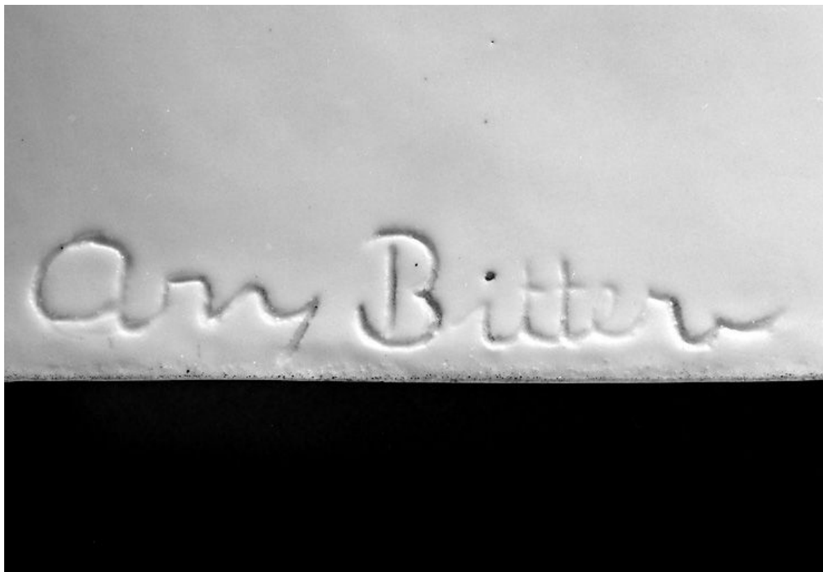
Signature du sculpteur Ary Bitter.