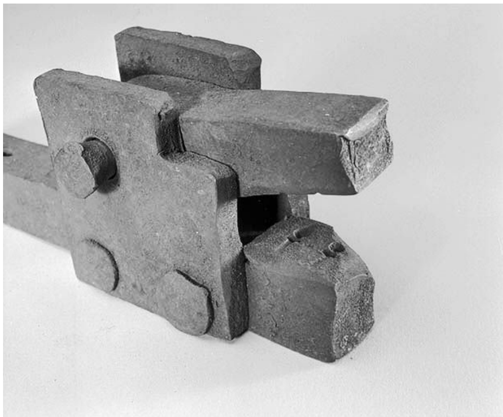
Cloutière : détail de la matrice pour les pointes de toupies.

39, La Mouille C.D. 69 E2, lieudit : le Bourgeat d'Amont