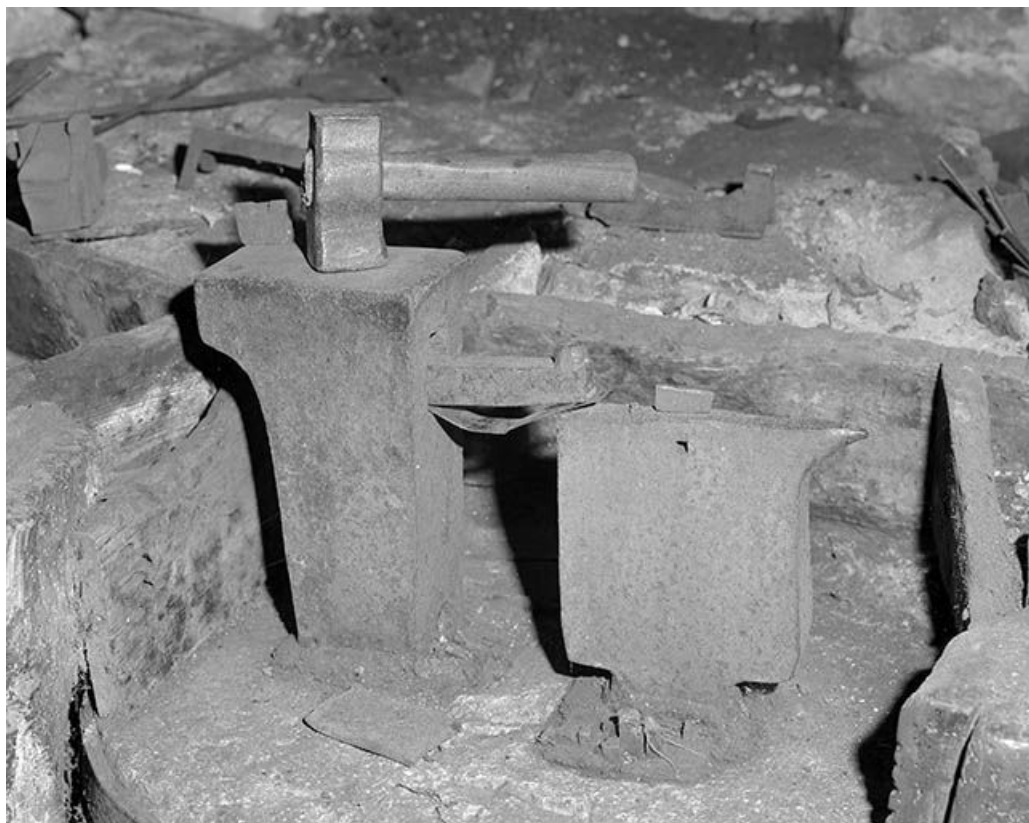
Poste de travail équipé avec la matrice pour les clous.

39, La Mouille C.D. 69 E2, lieudit : le Bourgeat d'Amont