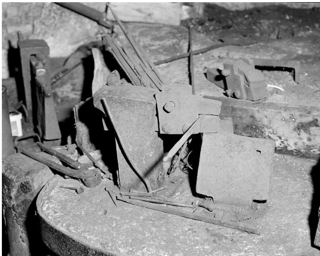
Poste de travail équipé avec une " cloutière ".

39, La Mouille C.D. 69 E2, lieudit : le Bourgeat d'Amont