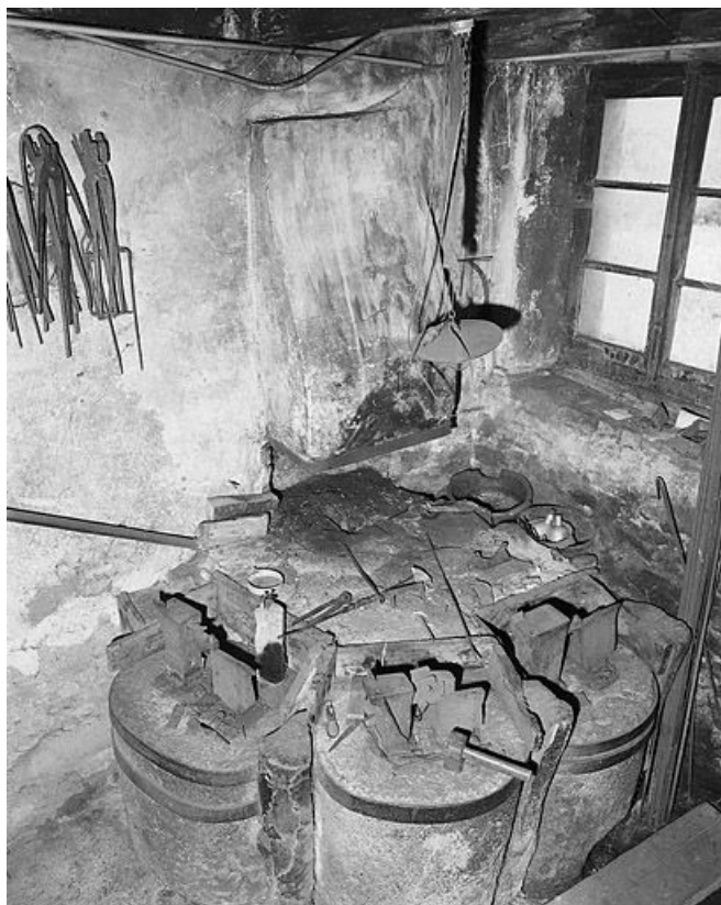
Vue d'ensemble plongeante sur les trois postes de travail.

39, La Mouille C.D. 69 E2, lieudit : le Bourgeat d'Amont