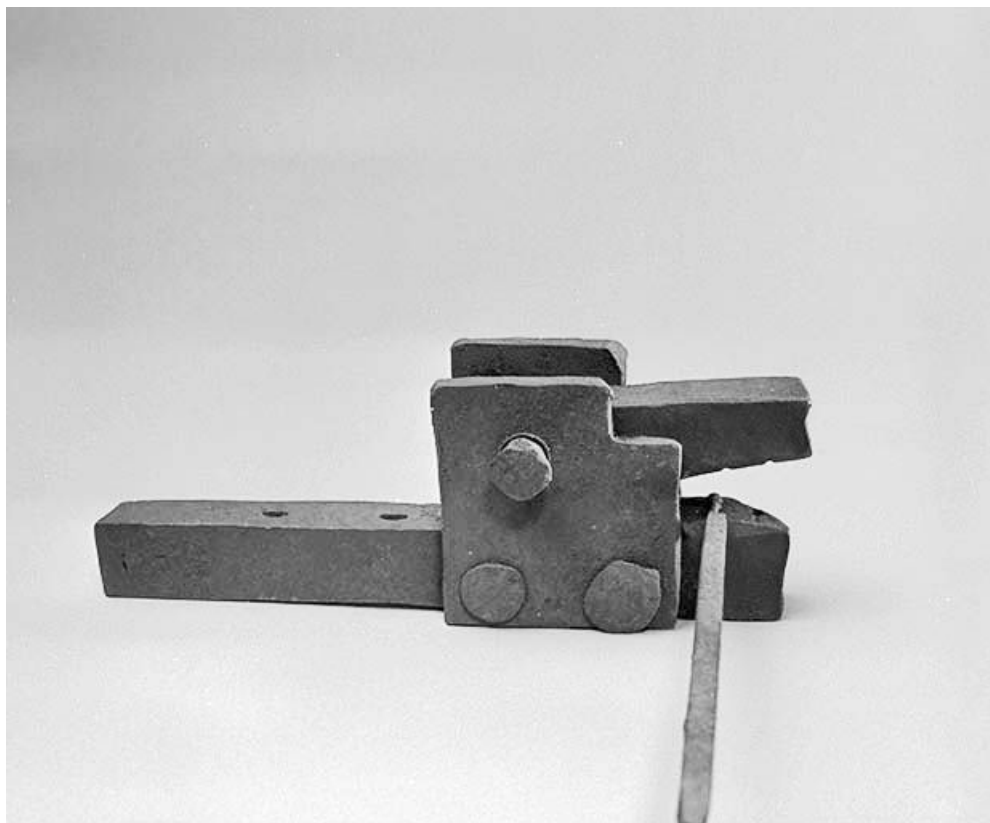
Cloutière avec un bâton de section carré servant à la fabrication des pointes de toupie ("fiardes"). 39, La Mouille C.D. 69 E2, lieudit : le Bourgeat d'Amont