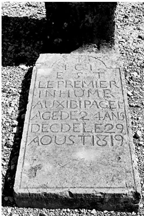
La pierre tombale, vue de face.