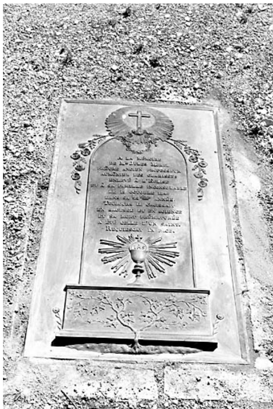
La pierre tombale.