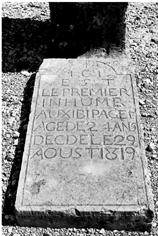
La pierre tombale, vue de face.