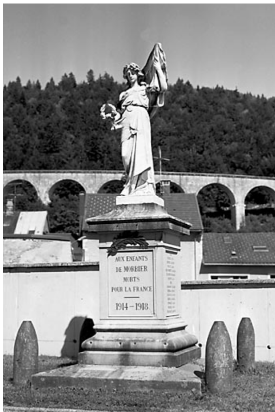
Vue générale, de face.